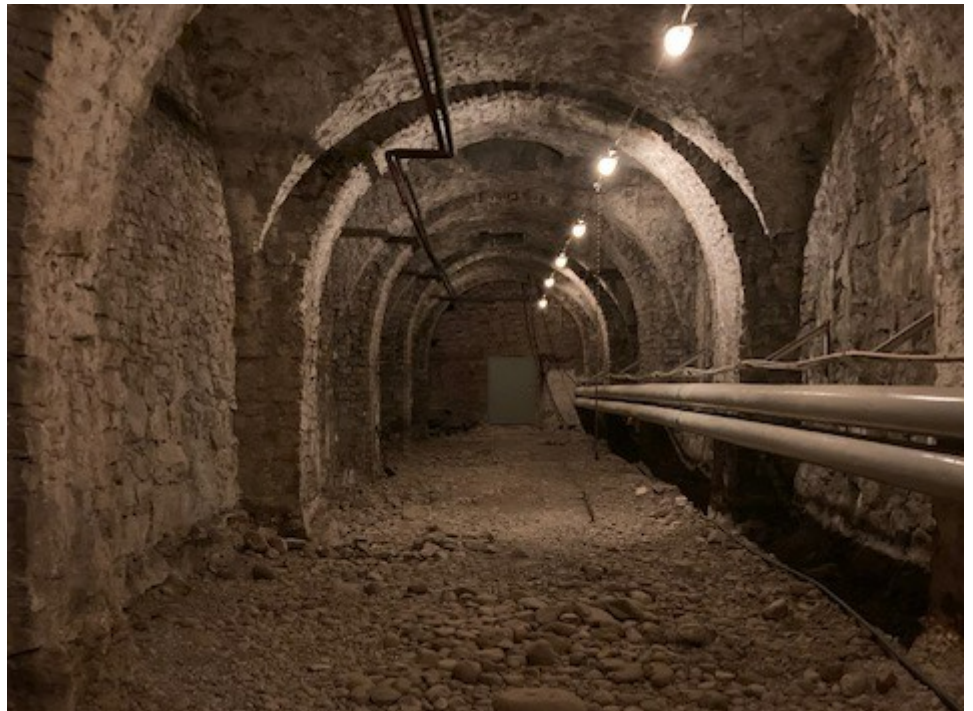
Likkällaren som sträcker sig mellan den västra och östra paviljongerna.

Likkällaren uppfördes i samband med att paviljongerna byggdes 1767 och sträcker sig under hela utrymmet mellan dessa. Källaren nås via en trappa i den östra paviljongsbyggnaden och utgörs av ett kryssvälvat rum om sju valvtravéer. Fram tills begravningsverksamheten i och kring Storkyrkan upphörde i slutet av 1800-talet användes rummet till förvaring av lik. Likkällare av motsvarande proportioner är ovanliga och rummets oputsade valv- och väggkonstruktion har höga byggnadshistoriska värden.