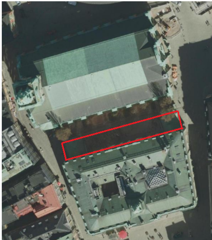
Likkällaren och de två paviljongerna är inom den röda fyrkanten på bilden.

Som ersättningslokal föreslås likkällaren och de två paviljongerna. Dessa föreslås i ett första skede användas som ersättningslokaler för den publika verksamheten. I ett andra skede, när verksamheten kan flytta in i Börshuset, kan lokalerna ingå i ett större offentligt utbud som innefattar såväl likkällaren med paviljonger som lokalerna i Börshuset.