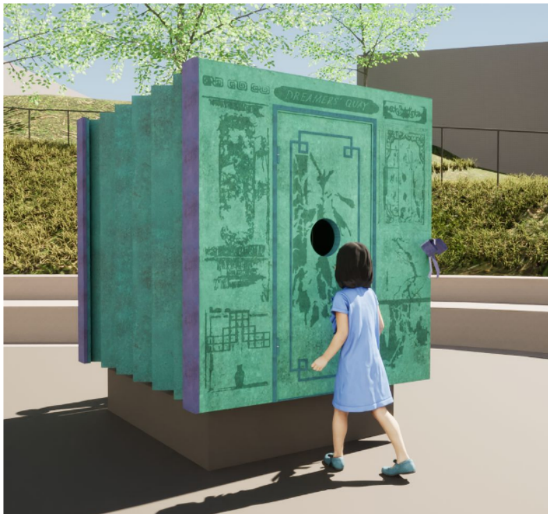
Närbild skulptur utifrån