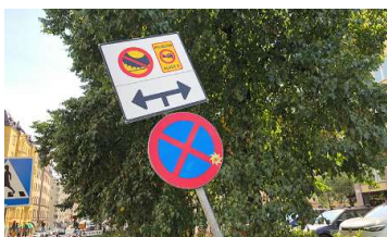
Dubbdäcksförbud och miljözon