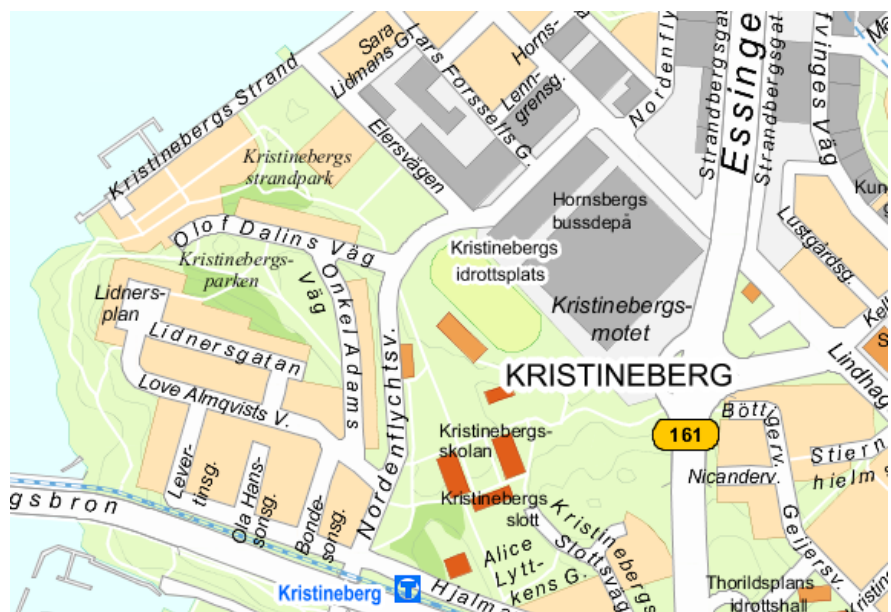
Karta över Kristineberg idag.

I medborgarförslaget framhävs att området Västra Kungsholmen ständigt växer och att det behövs fler och större utrymmen för barns aktiviteter på skoltid och fritid.