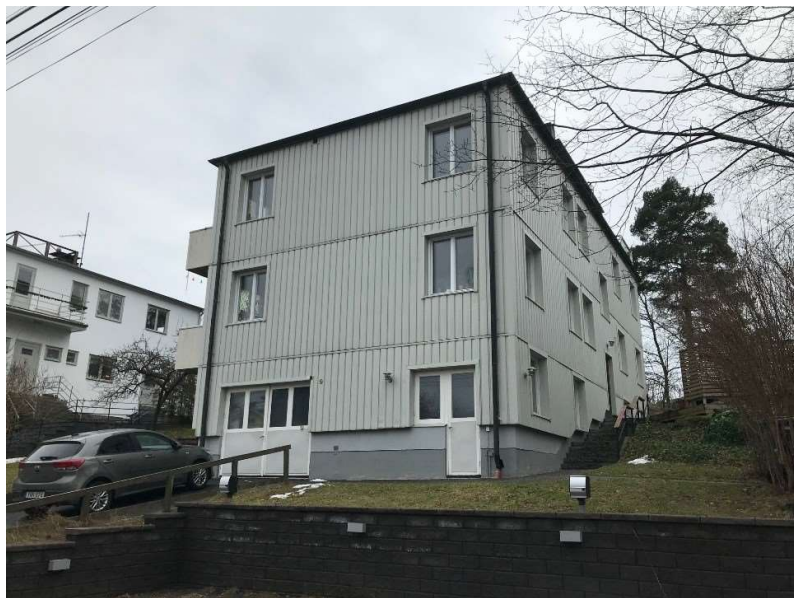
Fastigheten sedd från Norrskogsvägen, där den nedre våningen är tänkt att omvandlas till en ny lägenhet.

Bostadshuset uppfördes år 1937. Det är ett suterränghus i 3-4 våningar och byggdes ursprungligen i funkisstil. Byggnaden är oklassificerad enligt Stadsmuseets byggnadsklassificering, Fastigheten ingår dock i den del av Stora Essingen som klassificerats som kulturhistoriskt särskilt värdefullt.