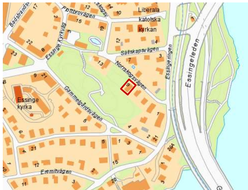
Karta som visar fastighetens avgränsning, markerad med röd linje.

Fastigheten Gammelgården 5 ligger på Norrskogsvägen 9 på Stora Essingen och omfattar ca 770 kvm. Fastigheten ägs av bostadsrättsföreningen Gammelgården 5.