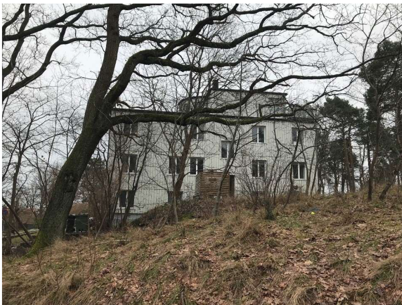
Fastigheten sedd från östra långsidan.