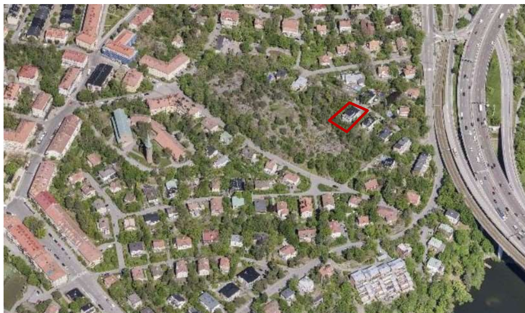
Snedbild över del av Stora Essingen med Gammelgården 5 markerad med röd linje.

Natur och landskapsbild Grönstrukturen i området utgörs av privata trädgårdstomter, obebyggda höjdområden med trädbevuxen naturmark samt stadsdelsparker.