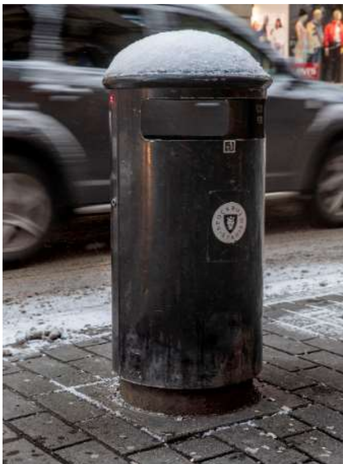
En av stadens ca 12000 skräpkorgar

Ett stort antal av de befintliga skräpkorgarna är relativt små och därmed inte anpassade för dagens livsstil där det är vanligt att köpa med sig mat i olika typer av förpackningar som snabbt kan fylla upp en skräpkorg. Trafikkontoret och stadsdelsförvaltningarna arbetar därför med en långsiktig plan för att byta ut äldre korgar mot större papperskorgar och till komprimerande kärl, bland annat på platser som periodvis har många besökare som t.ex. parker, torg och andra stråk. I samband med utbyte av skräpkorgar kommer samtliga nya utrustas med askkopp för uppsamling av fimpar. För att minska risken att skräp hamnar i vattnet där det är svårt och dyrt att samla upp är det extra viktigt att t.ex. badplatser, kajer, bryggor och strandnära lägen har en effektiv avfallshantering och städning. Antal och placering av skräpkorgar kan också anpassas utifrån årstid och olika händelser eftersom det i hög grad kan påverka besöksantal och beteenden på platsen.