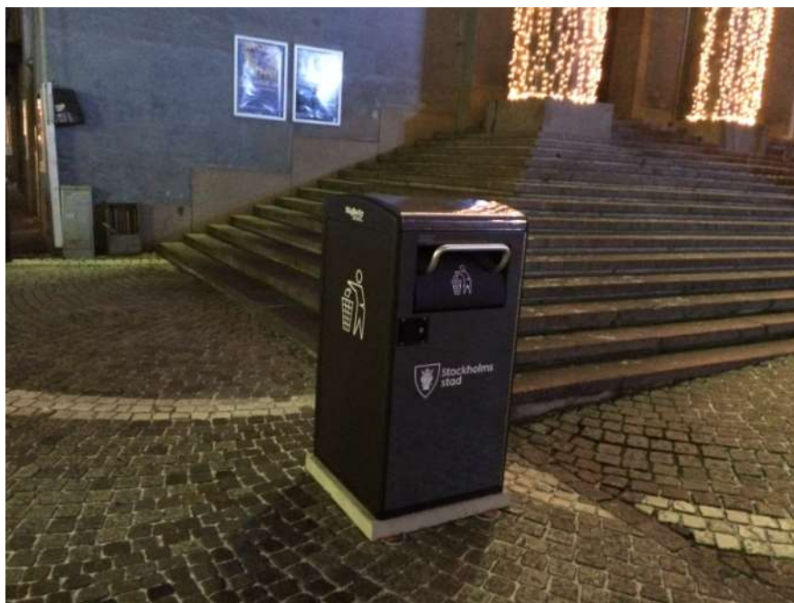
Komprimerande sopkärl som drivs av egengenererad solcellsel

Komprimering av avfallet och tömning då kärlet är fullt kan leda till färre transporter om det kombineras med anpassning av arbetssätt och tömningsfrekvenser. Eftersom kärlet är stängt minskar också risken för att fåglar och andra skadedjur kommer åt avfallet vilket minskar risken för nedskräpning. Kontoret har för avsikt att ansöka om klimatinvesteringsmedel för att finansiera kommande investeringar i komprimerande sopkärl.