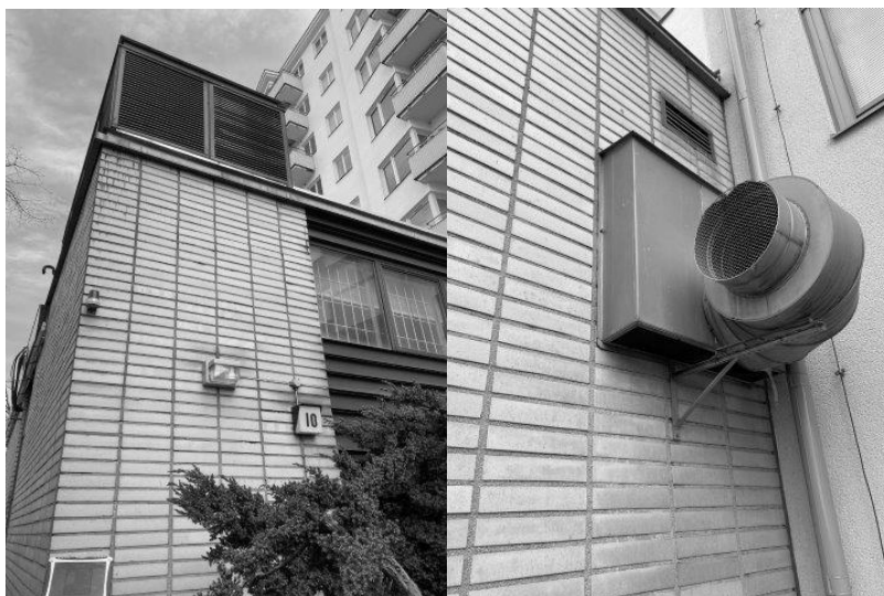
Bild 1, Av-/uteluftsdon och kombihuv vid Syssemansgatan 10

Förskolegården ligger på innergård som vetter både mot Drottningholmsvägen och Syssemansgatan. Runt gården finns ljudkällor såsom av- och uteluftsdon samt kylmedelskylare. Trafikbuller från främst Drottningholmsvägen påverkar förskolegården.