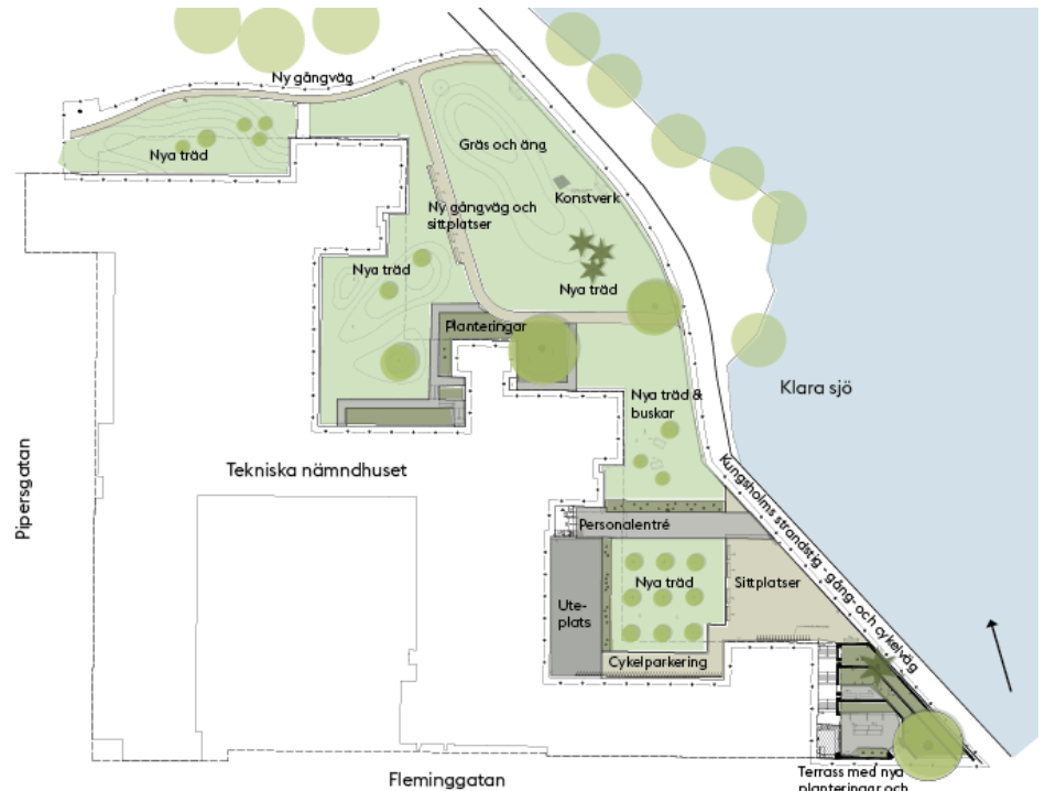
Översiktsritning som visar huvuddragen i upprustningen.