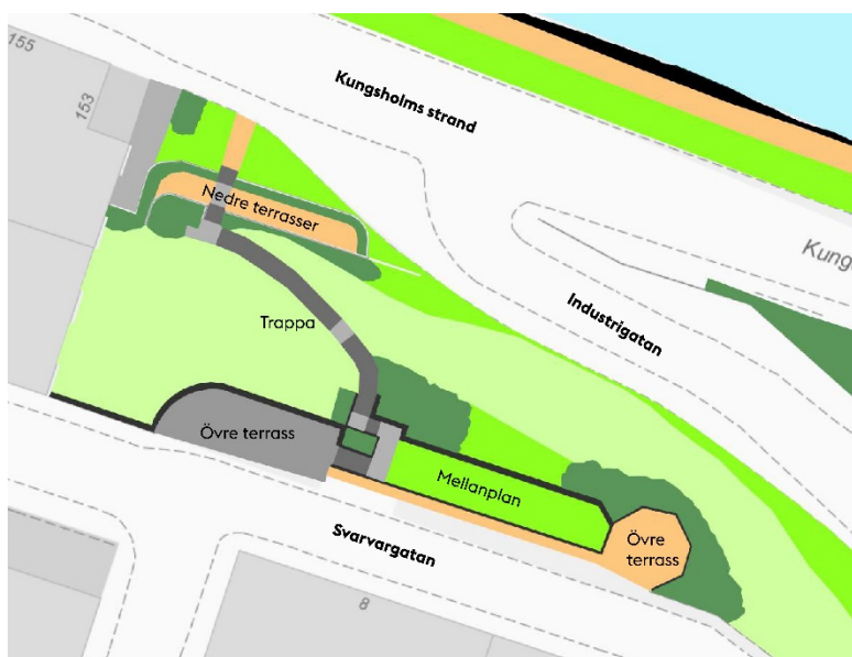
Figur 2 - Karta som visar parkens terrasser och trappan.

I Parkplan Kungsholmen (2017) beskrivs hur den vackert svängda trappan runt berget och de kalkstenskrönta granitmurarna ger parken en tilltalande utformning och ett gediget och välformat uttryck. Konstruktionerna som anlades under 1930-talet bedöms av förvaltningen vara viktiga att värna ur kulturmiljösynpunkt. Skönhet, rofylldhet och ekosystemtjänster beskrivs i parkplanen som värdefulla aspekter att värna och utveckla i parken. Enligt parkplanen kan det göras genom att tillskapa blomsterprakt med blommande buskar, rusta och återskapa grusgångar och grusytor samt arbeta för återkommande slyröjning och föryngring av