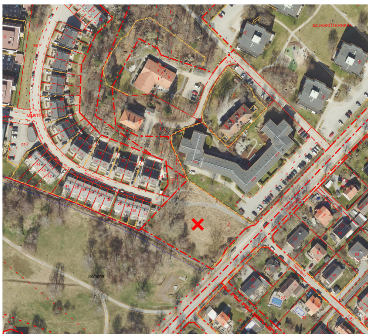
Fastigheten Sjuksköterskan 4 markerad med rött kryss

exploateringsnämnden. Fastigheten kommer att upplåtas till bolaget med tomträtt. Enligt den av styrelsen beslutade planen för utbyggnad av seniorbostäder ska ca 1 100 nya seniorbostäder byggas till år 2040. Det här är den första planerade nybyggnationen i västerort.