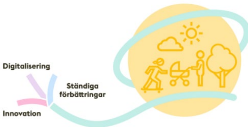
Figur 1 Illustration från stadens kvalitetsprogram.

Digitaliseringsplanen innebär en konkretisering av stadens kvalitetsprogram för området äldreomsorg avseende ständiga förbättringar och innovation som möjliggörs av digitala produkter och tjänster.