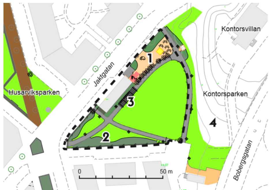
Jaktparken med 1. lekplats, 2. odlingslådor och 3. en öppen gräsyta.

gräsyta, en lekplats samt odlingslådor för stadsodling. Då den närliggande förskolan Sandön endast har en utsläppsgård började en stor del av verksamheten bedrivas i Jaktparken. I samband med detta byggdes staket med grindar runt parken samt en lekyta, med bland annat sandlåda och rutschkana, för att bättre kunna tillgodose förskolans behov.