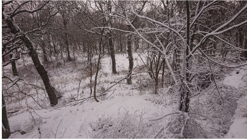
Vy efter slyröjning, Ekhagen