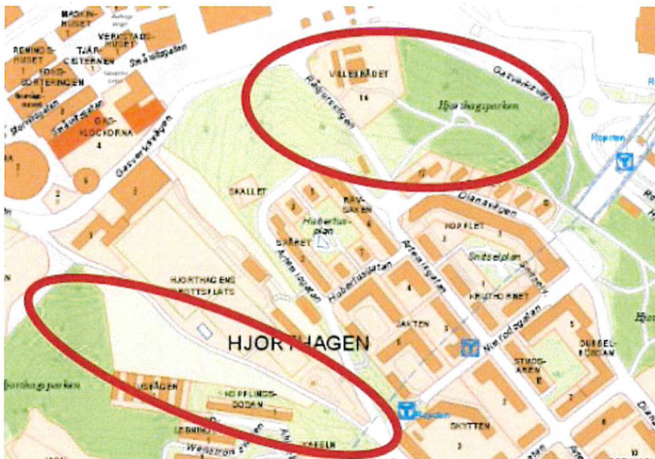
Figur 1. Utredningsförslagets (olämpliga) förslag på skogsområden att bebygga i Hjorthagsparken.

På stadsbyggnadsnämndens möte 9/12 2021 skall nämnden fatta beslut om ytterligare exploatering i Stockholm. På bordet ligger bland annat ett utredningsförslag om att exploatera och permanent bebygga två stycken skogsområden i Hjorthagsparken i Hjorthagen (Östermalm) med upp till 400 lägenheter. Ärendenumret är §013: 2021-14449. Se nedan.