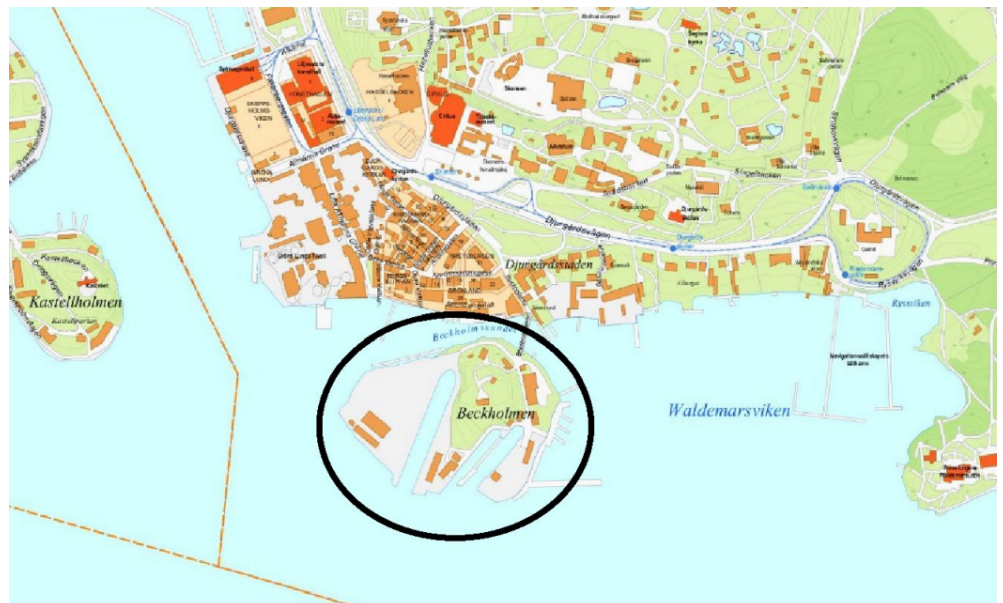
Beckholmen med omgivning, planområdet markerad med svart ring.

Planområdet omfattar fastigheten Djurgården 1:38 mm. Beckholmen är en ö som ligger i Stockholms inlopp, söder om Södra Djurgården. Ön angörs landvägen från Beckholmsbron som ansluter till Djurgårdsstaden i norr. Beckholmen ägs av staten genom Statens Fastighetsverk. Kungen har enskild dispositionsrätt till mark och byggnader. Dispositionsrätten förvaltas av Kungliga Djurgårdens förvaltning. Kungliga Djurgårdens förvaltning upplåter del av marken genom arrende till Stockholms Reparationsvarv AB (SRVAB) och Beckholmens Dockförening. Planområdet omfattar cirka 61 000 kvm.