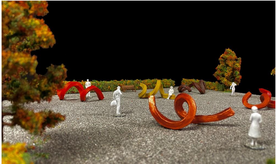
Förslaget i modell sett från nordväst/Hedinsgatan. Modellen är byggd i skala 1:50.

Krumelurerna tillverkas i glasfiber som kan göras så starkt att de tål att man sitter på dem eller att man lutar sig mot dem. I krumelurernas ändrar kan ljuskällor fällas in för att både göra dem mer intressanta kvällstid och för att tillföra mer ljus till platsen. Exakt hur de ljussätts kommer utredas i projekteringsskedet.