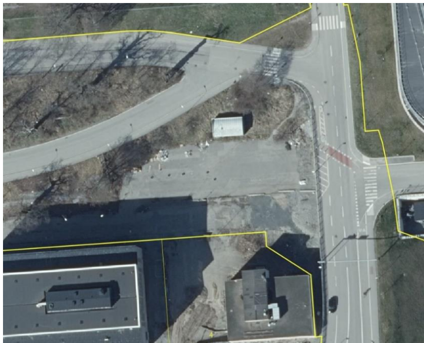
Befintlig cykelbana och övergångsställen efter ombyggnad. Gula linjer visar fastighetsgränserna enligt Lantmäteriets karttjänst.

Fotgängare på väg till Lidingövägen ska enligt nuvarande lösning gå upp en bit på Jägmästargatan för att komma över till andra sidan. Men många fotgängare väljer i stället – av avståndsskäl – övergångsstället söderut på Lanforsvägen och använder cykelpassagen för att korsa Jägmästargatan.