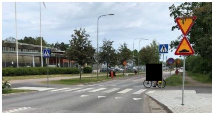
Ovan cykelöverfart med väjningsplikt för bilister. Vägmärke för cykelöverfart saknas dock.

Vägningsreglerna vid korsande cykelbana är för många oklara. Om vägmärken för cykelöverfart och väjningsplikt finns borde det flesta förstå.