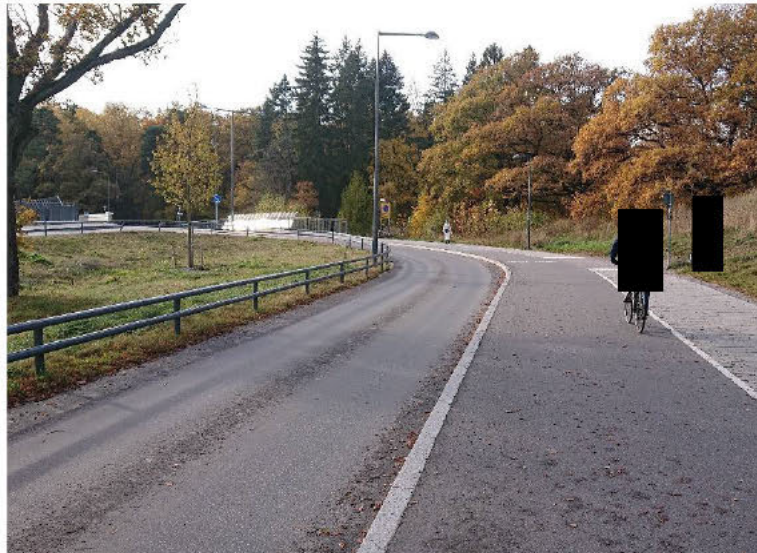
Ovan Bobergsgatan vid infarten till Norra Djurgårdsstaden. Cykel- och gångbana längs bilväg av samma typ som ovan föreslås anläggas längs Lanforsvägen.