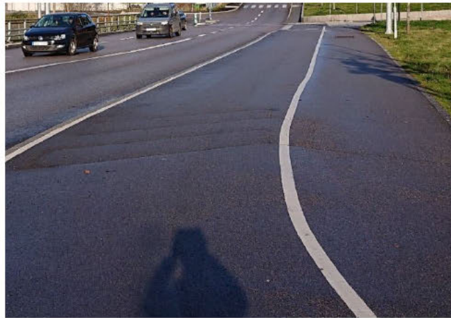
Befintlig cykelbana längs Jägmästargatan.