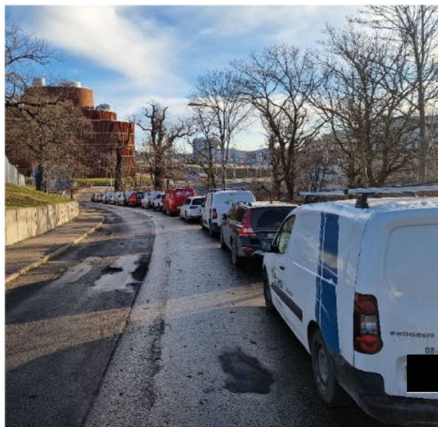
Lanforsvägen till Abessinien uppifrån.

Antalet cyklar i Abessinien har de senaste åren ökat och cykelförråden är numera överfulla. Staden vill främja cyklandet och bygger kontinuerligt nya cykelbanor.