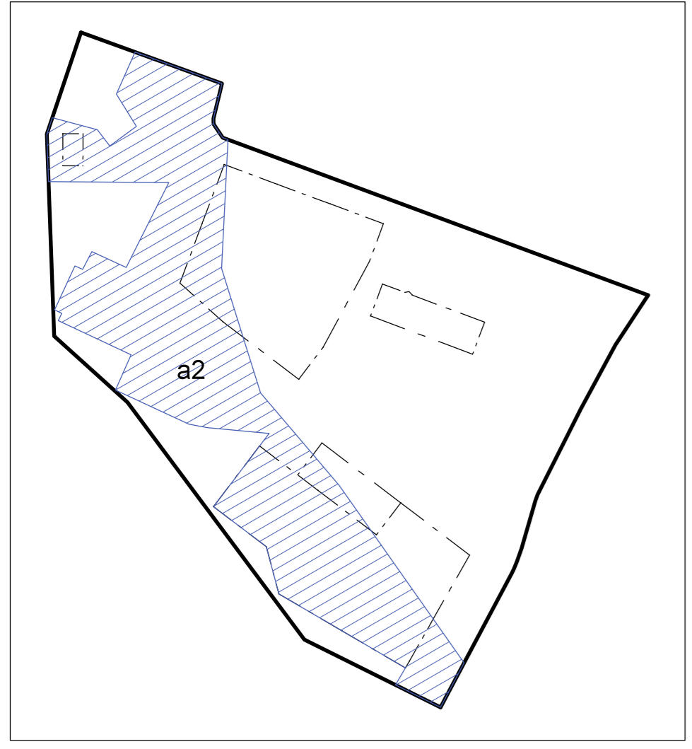
Illustration A. Strandskydd upphävs inom planområdet enligt blå skraffering.