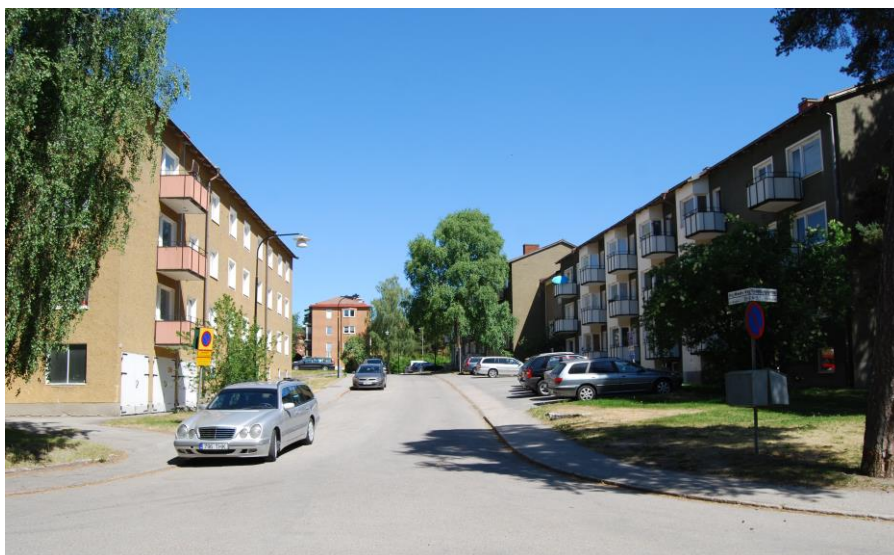
Korsningen Grundtvigsgatan-Kaj Munks väg. Kvarteren Upplänningen och Västgöten.