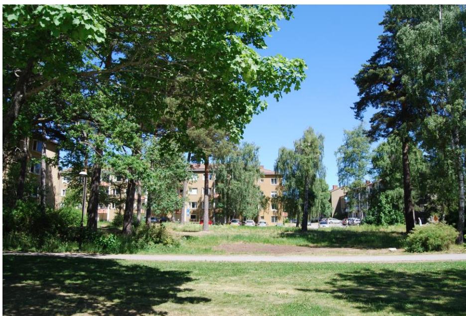
Förskoletomten mot nordost.