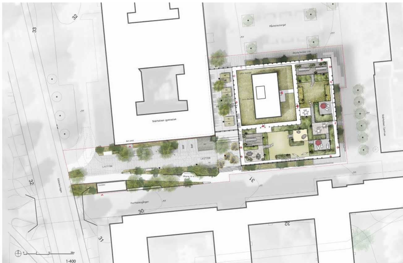
Fig Situationsplan förslag

Det nya kontoret och bostäderna får entréer mot Ekholmsvägen och Bredholmstorget. De senare utgör entréerna för de som färdas kollektivt, cyklar eller går. Tillfarten mot Ekholmsvägen är befintlig men föreslås något justerad. Detta som följd av att en iordningställd passage mellan Portholmsgången och Ekholmsvägen föreslås. Transporter till kvarteret liksom sophantering nyttjar denna anslutning.