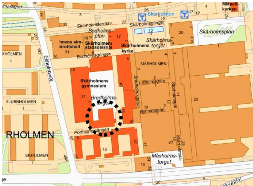
Fig Läge för nytt kontor och bostäder

Den blivande kontorsbyggnaden är inrymd mellan Portholmsgången i söder, Ekholmsvägen i väster, Bredholmstorget i norr och Skärholmen centrum i öster. Tillfarten till den blivande fastigheten sker via