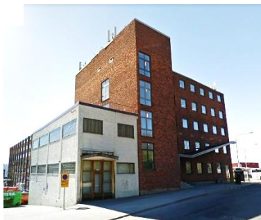
Byggnadens östra fasad utmed Voltavägen med det sidoställda trapphuset och den putsade lågdelen.

Fastigheten har i dag för delar av byggnaden både permanenta och tidsbegränsade bygglov för hotellverksamhet, kontor och handel. De tidsbegränsade byggloven gäller för som längst en period av 15 år och flera har gått ut.