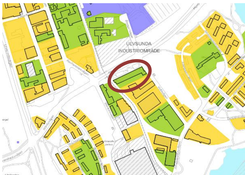
Utsnitt ur stadsmuseets klassificeringskarta. Magneten 23 är markerad med röd oval.