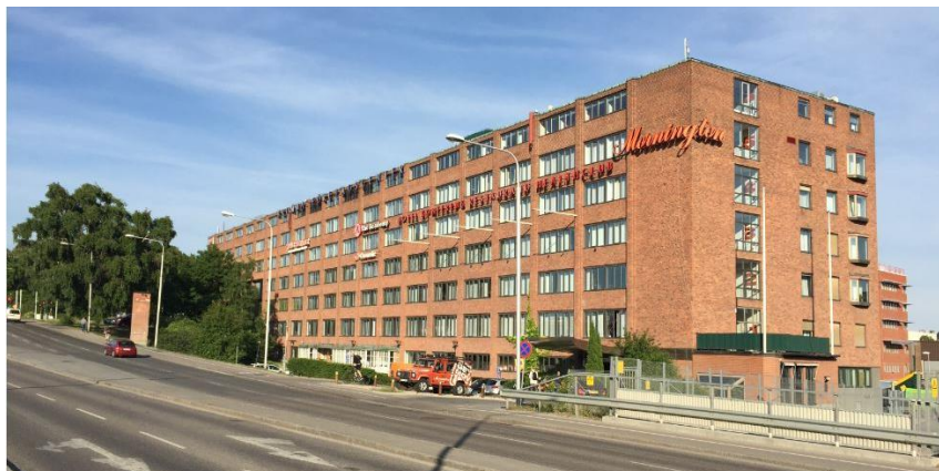
Byggnadens norra fasad utmed Norrbyvägen/Huvudstaleden. Hotel Mornington i Bromma förhyr ca 8 600 kvm (BTA) av byggnaden för hotellverksamhet Tvärbanans område syns till höger i bilden.