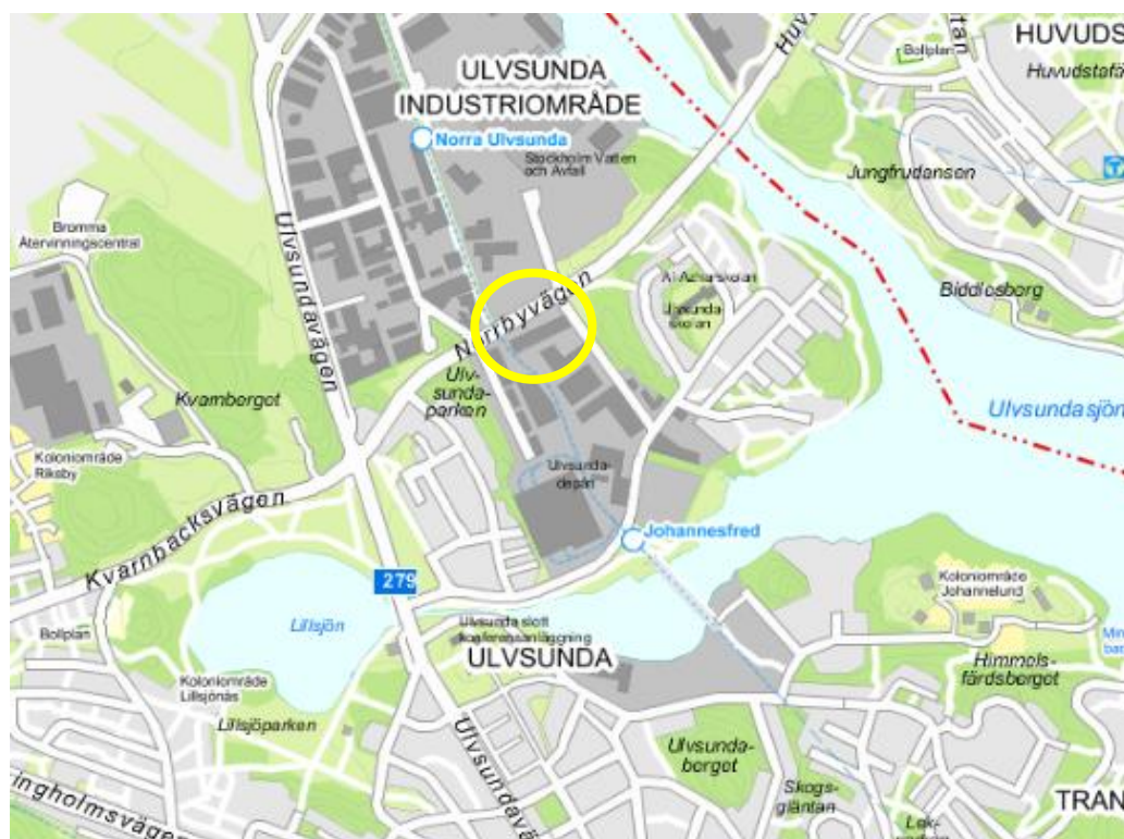
Planområdets läge markerat med gul ring