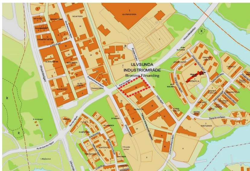
Kartöversikt, planområdet markerat med röd punktlinje.