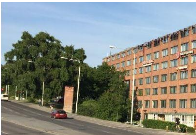
Bild som visar parken med de stora träderna vid Norrbyvägen. De två parkeringsplatserna, den övre och den nedre, skymtar bakom växtligheten.