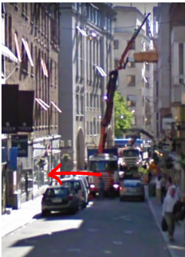
Röd pil visar var materialintag i stomkompletteringsskedet.

Beroende på vilken utformning av yttertaket som kommer att utföras så används olika metoder. Fasadernas öppningar kompletteras med fönster och partier när stagning är nere, restaureringen av fasaden går parallellt med stomkompletteringen.