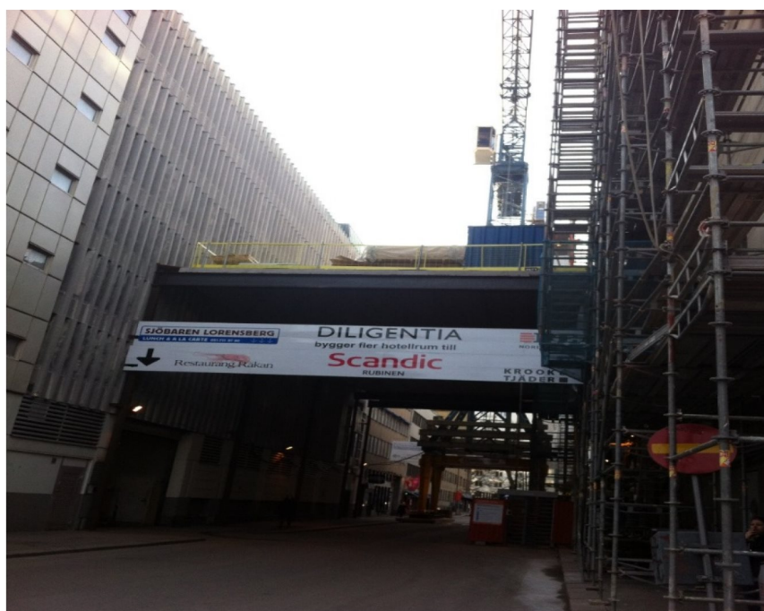
exempel på portal för logistik.