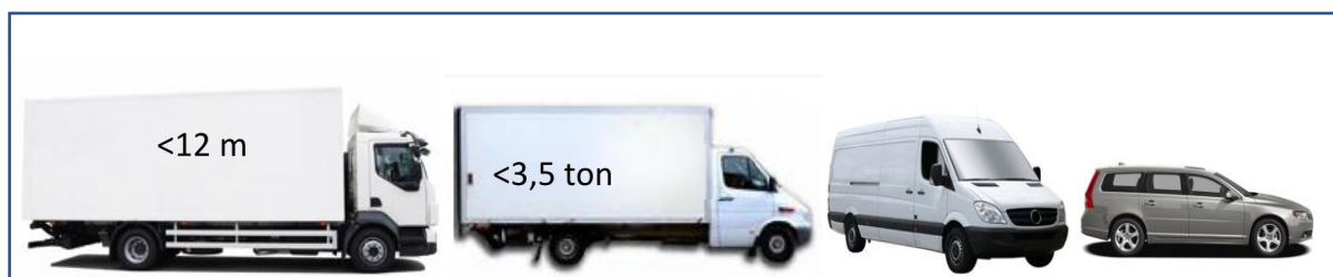
Tung lastbil, TL