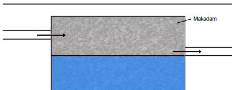
Tabell 8 Sammanställning av utformning av använt avsättningsmagasin, StormTac v19.2.1 2019-07-03