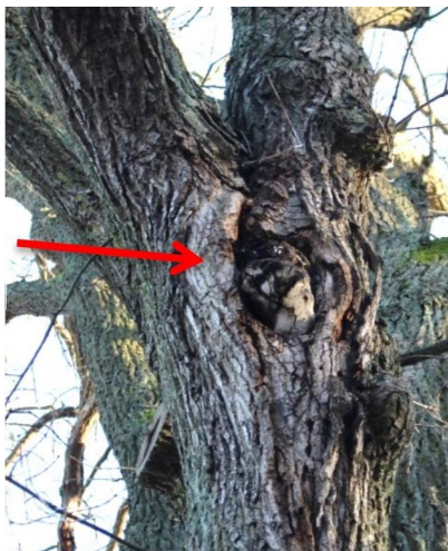
Bild 3 Större gren med invuxen bark samt en rötskada