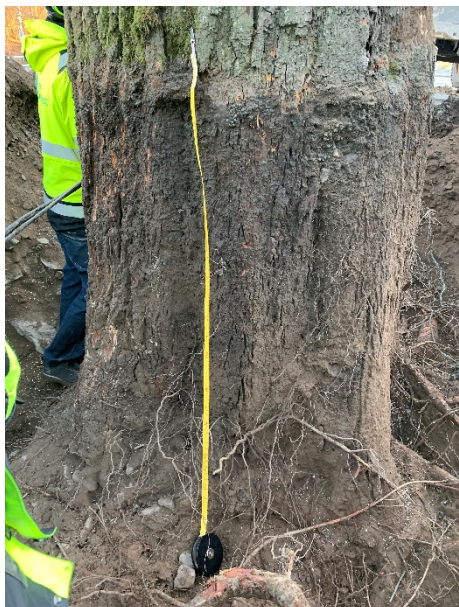
Bild 4 Ekens rotsystem 1 meter under nuvarande gatunivå