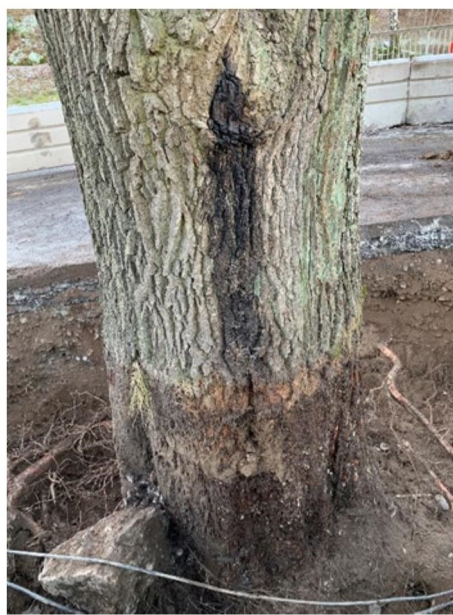
Bild 7 Stamsprickan är utbredd under marknivå