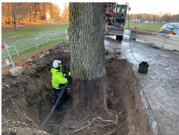
Bild 5 Oskadat rotsystem i den öppnade gropen