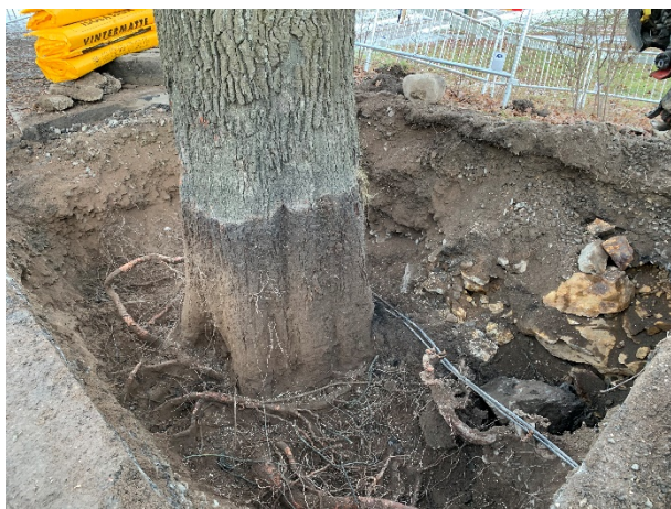
Bild 6 Oskadat rotsystem i den öppnade gropen

ek är ett av de trädslag som tål denna omilda behandling bäst och det tar därför många år, upp mot 60–80 år, innan trädet dör eller är i så dåligt skick att det måste fällas. Generella riktlinjer för markhöjningar kring träd är att det bör ske med stor försiktighet. Markhöjningar bör endast ske på mindre delar i trädens rotzoner och då uppbyggt med sorterat krossmaterial.