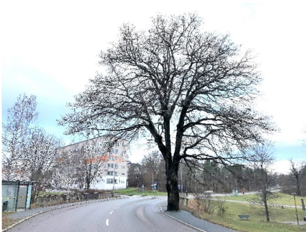
Bild 2 Trädet står i en asfalterad trottoar intill vägen

Påfyllnaden av schaktmassor runt eken har högst troligt skett vid anläggandet av den nuvarande utformningen av gatan, under 1960-talet. Påfyllnad av schaktmassor samt hårdgjorda och kompakta ytor leder till syrebrist för trädets rötter. I slutänden dör trädet helt och hållet på grund av syrebristen och koldioxidförgiftning. Trädslaget