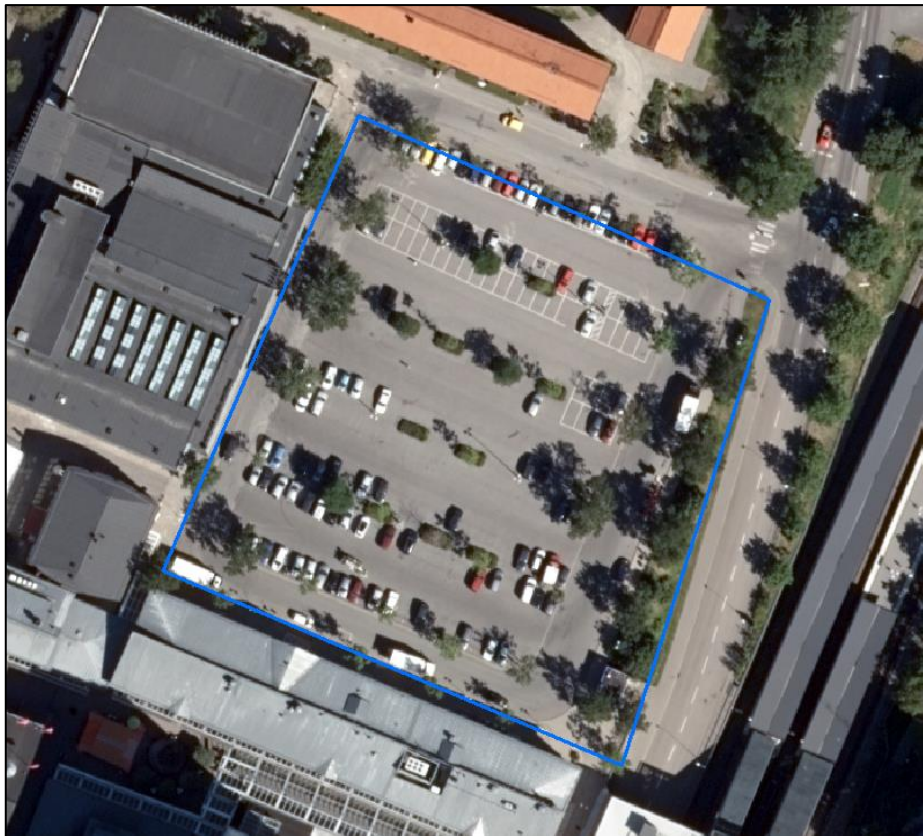
Figur 1. Undersökningsområdets utbredning.

Undersökningen syftar till att översiktligt redovisa föroreningsläget inom en avgränsad del av fastigheten. Undersökningens utbredning inom fastigheten har delvis begränsats av förekommande ledningsstråk, parkerade bilar och anläggningar.