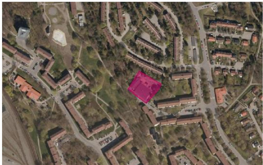
Figur 1. Ortofoto, fastighet markerad.

Syftet med detaljplanen är att ändra användning från dagens industriändamål till att medge förskola. I dagsläget inrymmer den befintliga byggnaden en kommunal förskola på 3 avdelningar med tillfälligt bygglov (2022-10-31), en gemensam tvättstuga, kontorsytor samt en kemptvätt. Inom fastigheten finns även ett förråd som förskolan använder som är placerad på mark som inte får bebyggas. På lång sikt är syftet att bedriva förskoleverksamhet i hela byggnaden varför det även ansökts om komplementsmark för större gårdsyta inom del av stadens fastighet Grimsta 1:2.