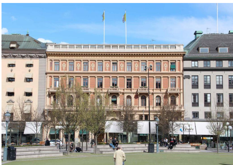
Figur 2 Fasadfoto på Kattthavet 7.