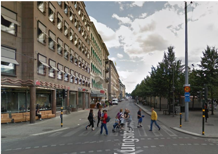
Figur 4 Gatuvy på Kungsträdgårdsgatan taget från Hamngatan (google.se/maps, hämtad 2019-11-26).