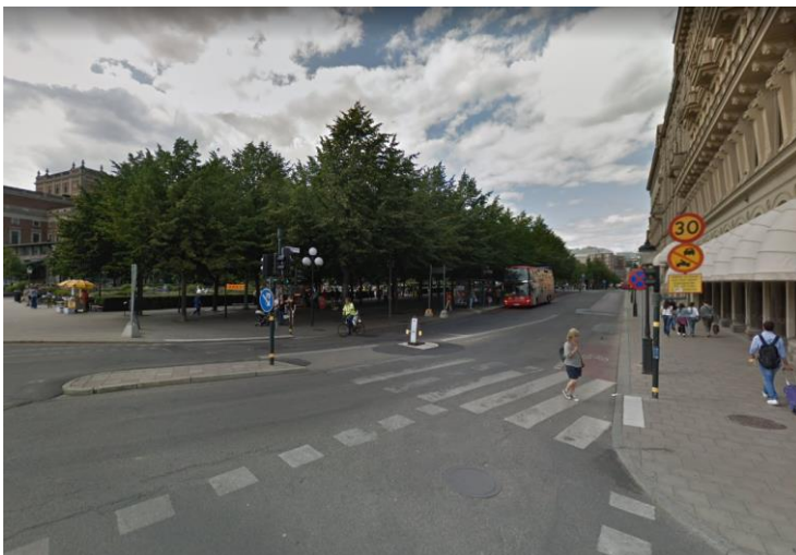
Figur 5 Gatuvy på Kungsträdgårdsgatan taget från Södra Blasieholmshamnen.

I området runt fastigheten finns ett stort utbud av kollektivtrafik: