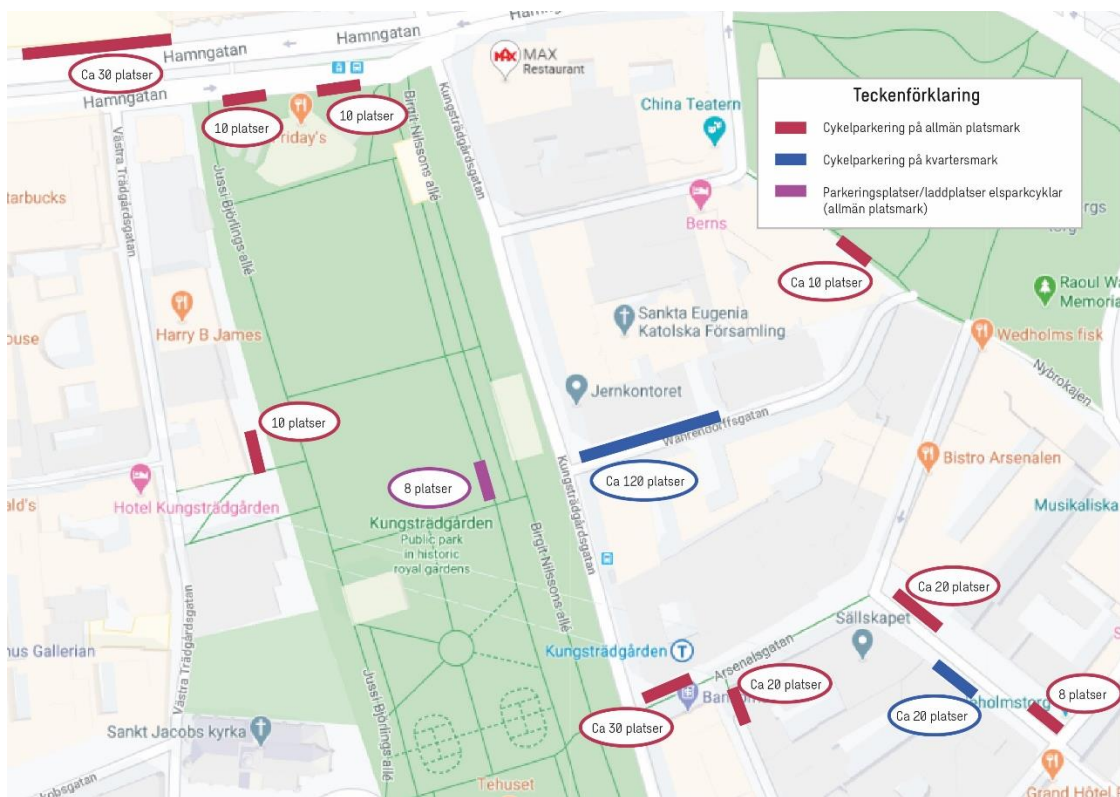
Figur 7 Cykelparkeringsplatser för allmänheten runt om fastigheten Katthavet 7.

Katthavet 7 skapar minimalt med transporter, där besökare till största del kommer med kollektivtrafik.