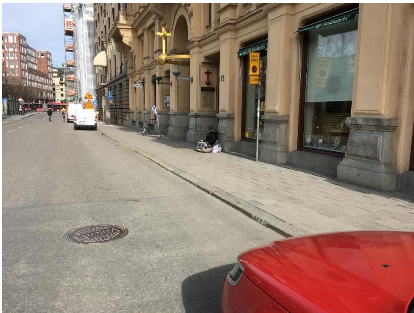
Figur 3 Angöring till fastigheten sker via lastplats på Kungsträdgårdsgatan.

Angöring till Sankta Euginas kyrka sker via lastplats på Kungsträdgårdsgatan, se figur 3 nedan. Intill lastplatsen finns en parkeringsplats avsedd för rörelsehindrade (RHP) samt en parkeringsplats med avgift.