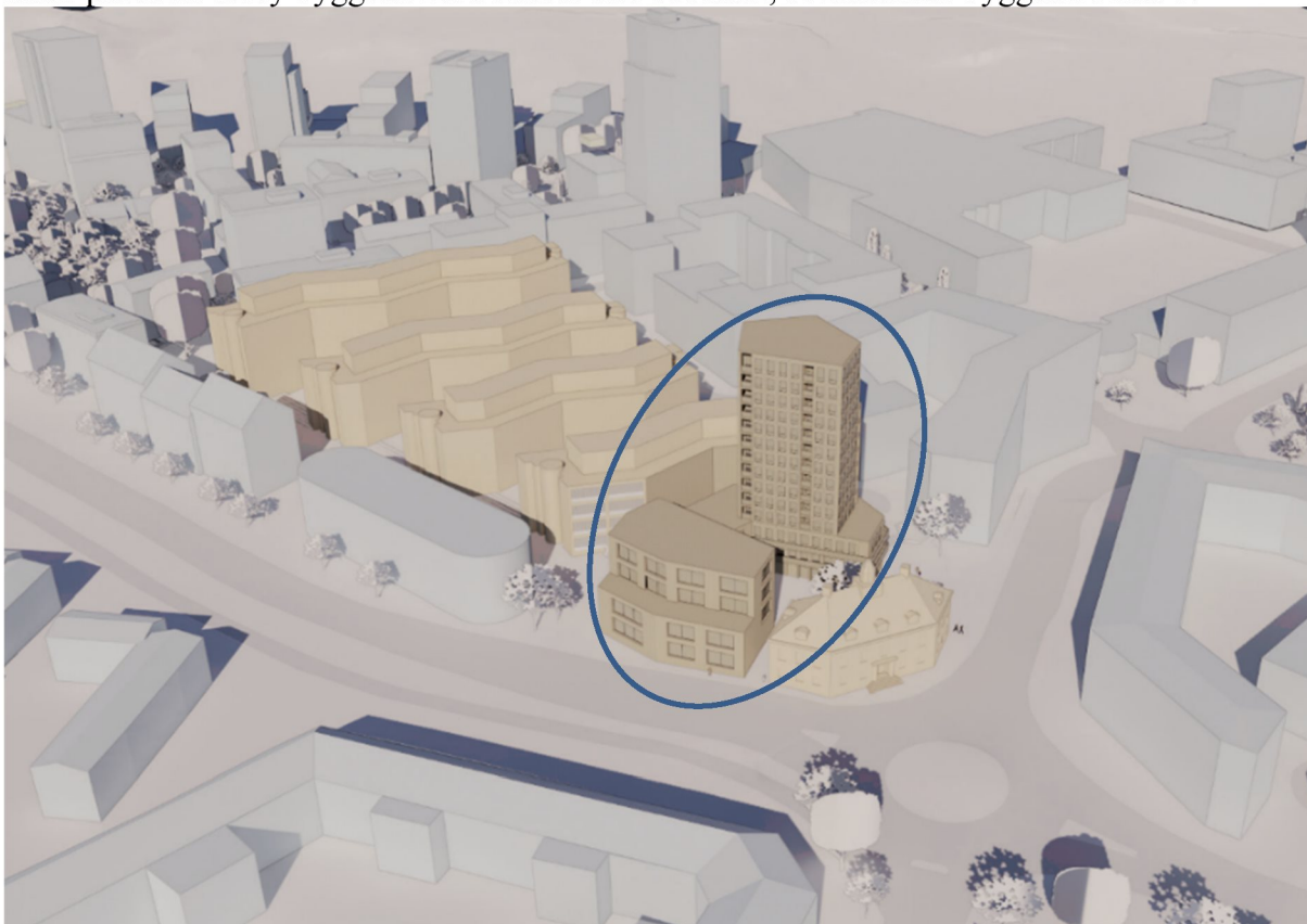
Bild 1: Illustration över planförslaget sett oavsnifrån. Nya volymer i brunt, befintliga i beige (AIX arkitekter)

I samband med framtagande av detaljplanen till Kabelverket 2 ska Hus 21 rivras. På samma ställe planeras en ny byggnad med kontor och bostäder, se markerad byggnad i bild 1.