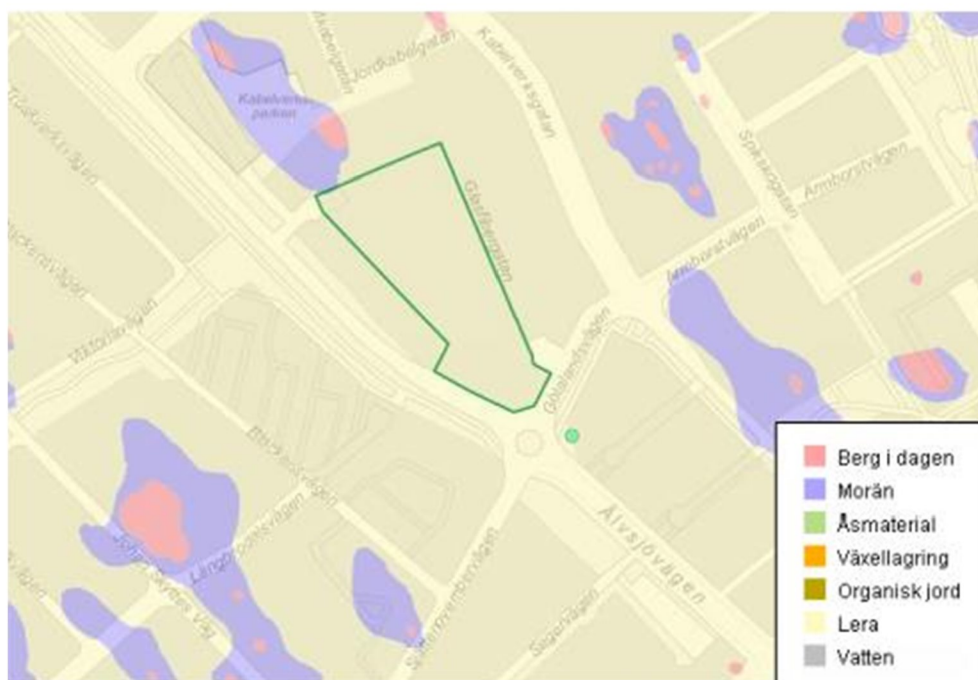
Bild 4: Byggnadsgeologiska karta över Stockholm, grön markerad KV Kabelverket. (källa: Startpromemoria för detaljplan Kabelverket 2, Dnr 2018-18246)

Väster om området går Älvsjövägen som är klassad som vibrationskänslig. På motsatta sidan av Götalandsvägen har trafikkontoret registrerat en vibrationsstörd byggnad markerad med grön punkt i Bild 4. Vidare planeras spårväg syd gå längs Älvsjövägen vilket i framtiden kan medföra ökad risk för vibrationer. I dagsläget har inga markvibrationsmätningar utförts på platsen.