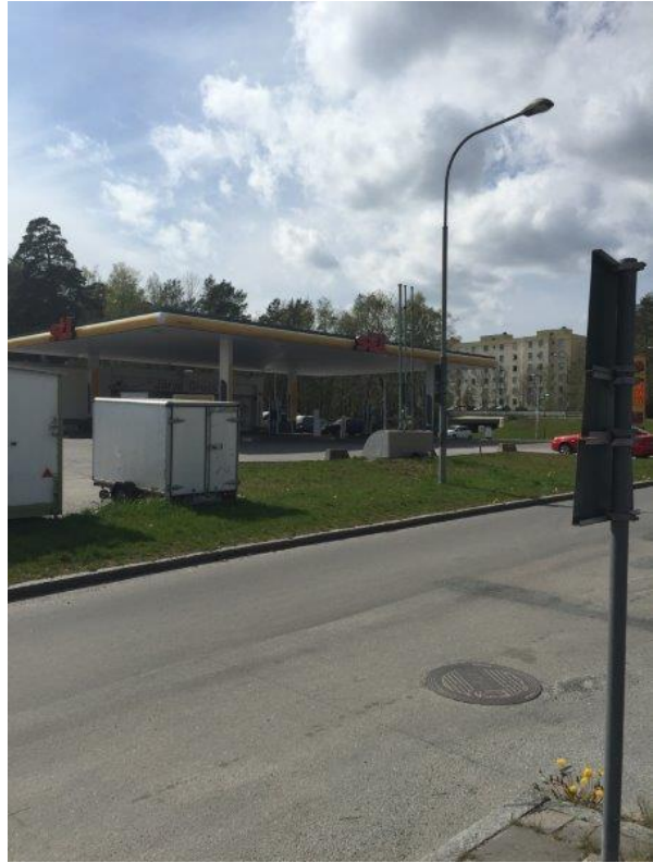
Planområde, innanför staketet där man planerar byggnation av ny restaurang, på andra sidan lokalgatan, Krällingegränd, en befintlig drivmedelsstation (St 1)