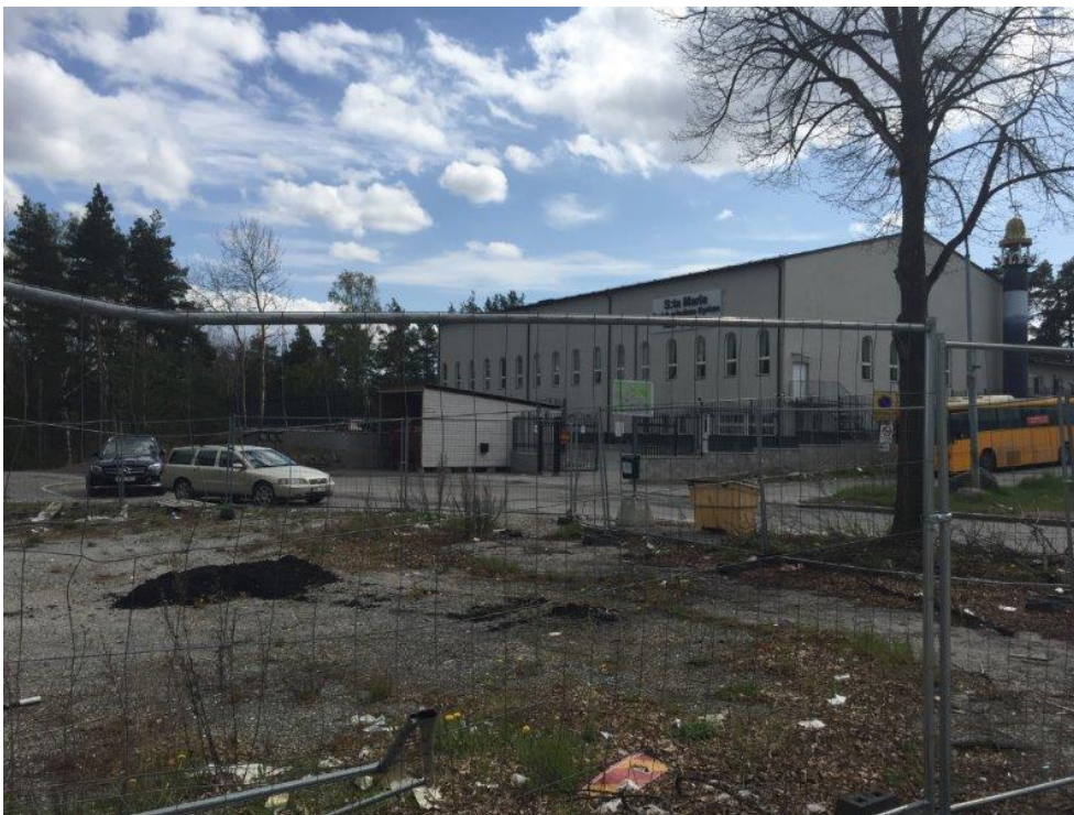
Intill nu aktuellt planområde finns också en större byggnad, kyrkobyggnad