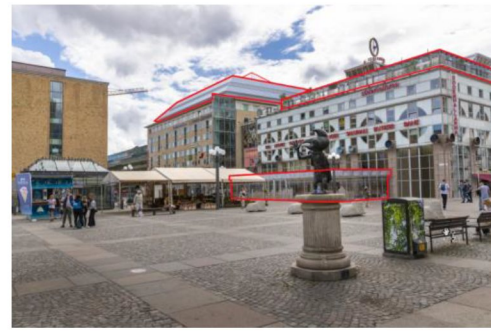
Vy från Medborgarplatsen