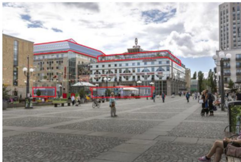
Vy från Götgatan