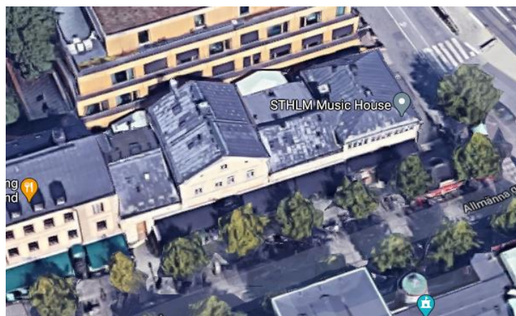
Vy från söder

Försörjning med kyla kan anordnas med egen kylmaskin eller försörjning från kylmaskincentralen i Konsthallen 2.