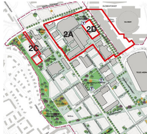
Planen visar illustrationsplan för etapp 2 med de tre detaljplaneområdena som tas fram.