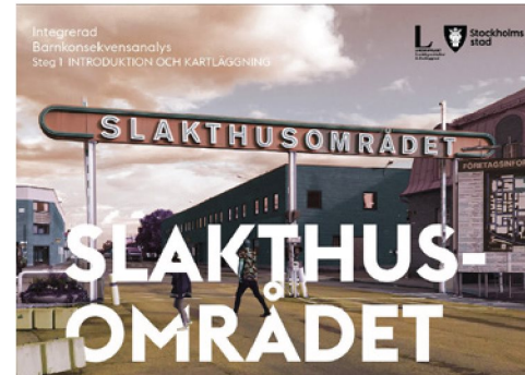
Integrerad barnkonsekvensanalys Slakthusområdet. Steg 1 - Introduktion och kartläggning (Landskapslaget, utkast daterad juni 2020).