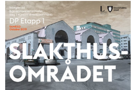
Integrerad barnkonsekvensanalys Slakthusområdet. Steg 3 - Konsekvensbedömning av Detaljplan Etapp 1. (Landskapslaget 2019)