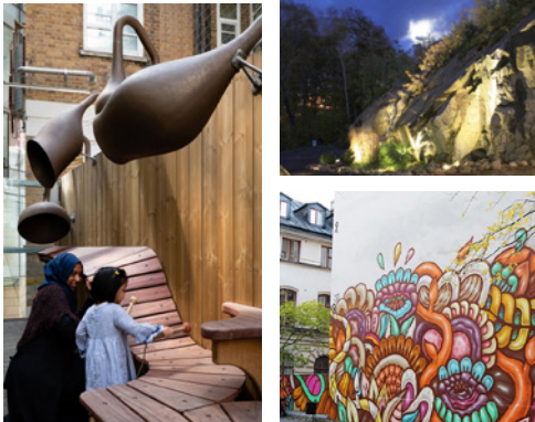
Förslag på hur gångstråket mot bergväggen kan aktivieras (ovan). Referensbilder är framtagna av Cedervall Arkitekter (2020).