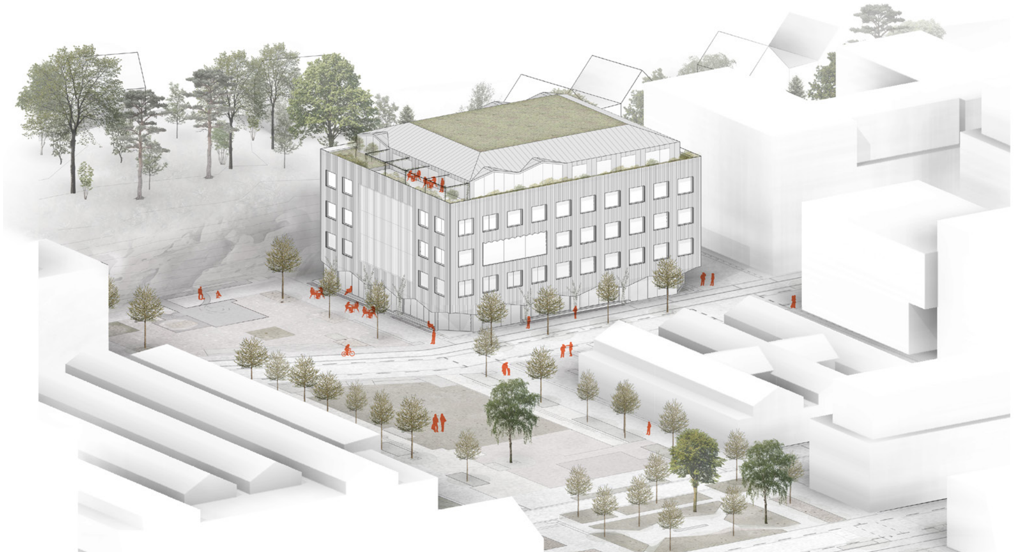
Föreslag på hur gymnasieskolan kan utformas. Bild av Cedervall Arkitekter (2021).