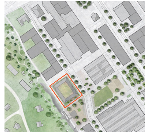
På planen är den nya gymnasieskolan markerad med en röd ruta. Bild av Cedervall Arkitekter (2021).