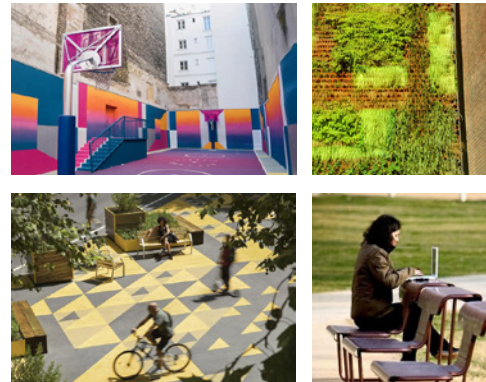
Visionsbilder på hur Västra gatan kan aktivieras. Referensbilder är framtagna av Cedervall Arkitekter (2020).