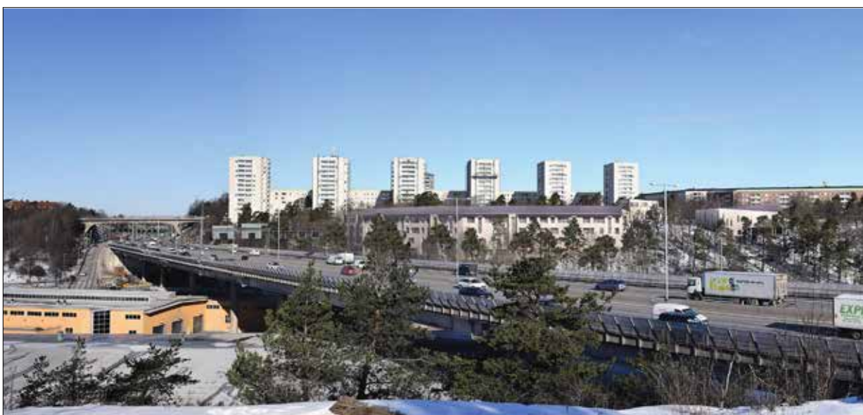
Föreslagen byggnad sedd från söder illustration ur Arkitema 2018-06-12.

I vyerna från längre avstånd, i söder och sydväst, bildar punkthusen i Nybohovs bostadsbebyggelse fondmotiv och utgör kraftfulla accenter (se KMLA 180208 , sid. 34). Mellan punkthusen och de stora trafiklederna ligger skogsbranterna som ett grönt bälte. Den nya skolbyggnaden konkurrerar inte med punkthusen men gör ett påtagligt intrång i skogsbältet och kommer att få en framträdande roll i Nybohovs bebyggelsefront mot sydväst.