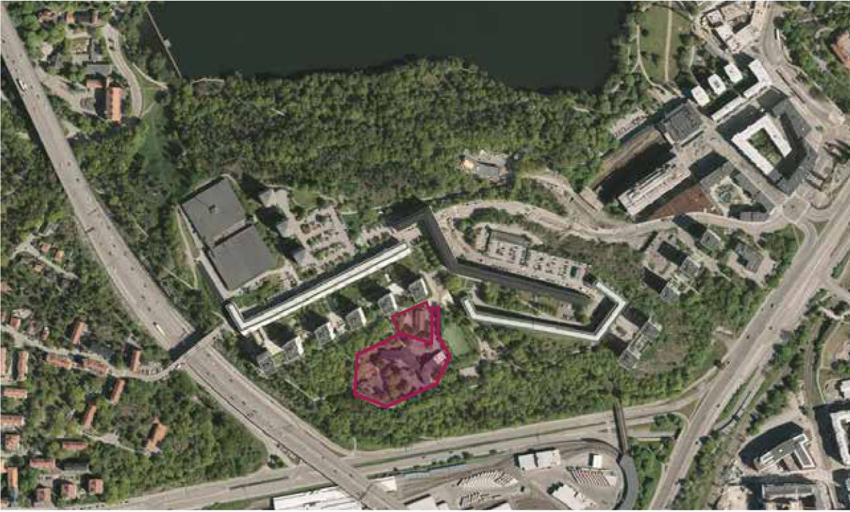
Nybohovsskolan i sin omgivning, ortofoto från Stockholms stad. Pytsen 1 och 2 rosamarkerade.