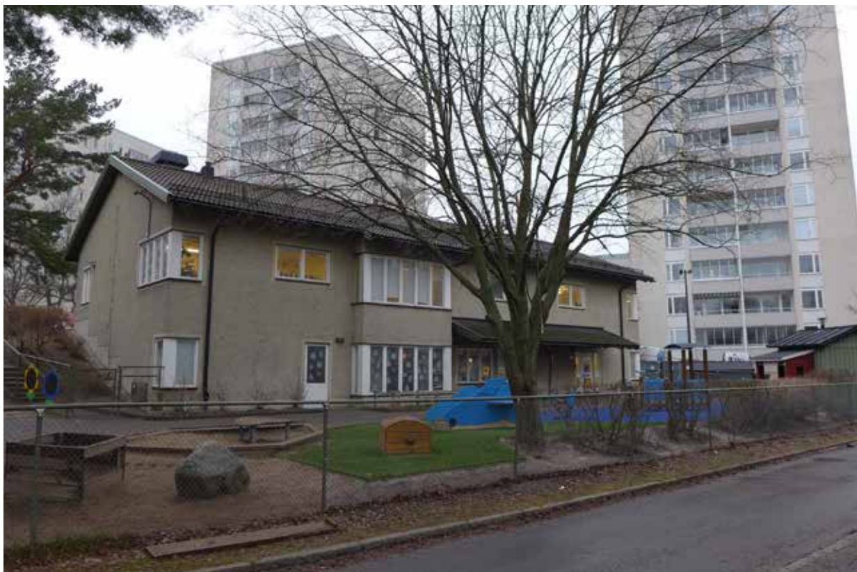
Förskolebyggnaden från sydöst, 2017-12-20.