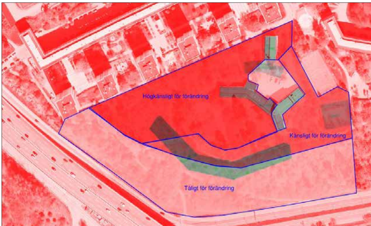
Alternativ L överlagt tålighets-känslighetsanalysen i KMLA 180208, sid 37. (Ej skalenligt.)

Den omslutande planformen och respektavståndet till det gamla skolhuset, som även medger anordnandet av en trygg och trevlig skolgård, är viktiga komponenter för bevarandet av platsens kulturhistoriska värden.