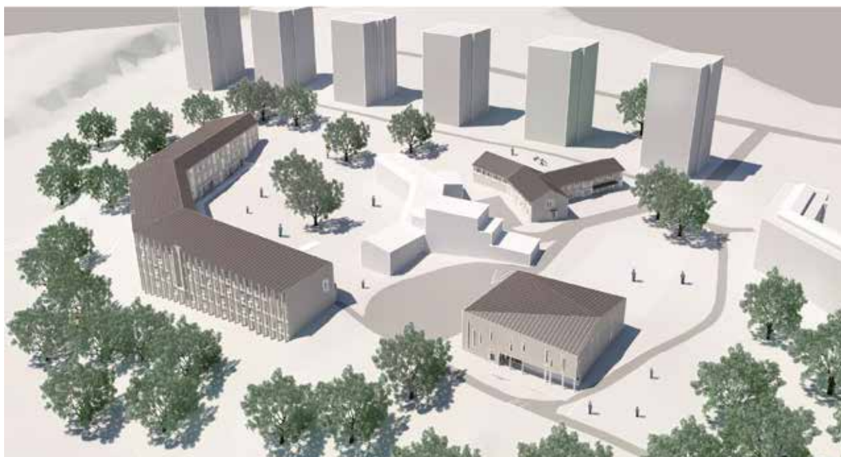
Fågelvy från sydöst över skolområdet som redovisar tillbyggnadsalternativet för förskolan och de första förslagen till gestaltning av skolhusets och idrottshusets fasader.

Förskolebyggnaden längst i norr med sin icke-modernistiska utformning får enligt alternativ 1 två tillbyggda längor som bildar en bred vinkel mot söder och en utökad förskolegård. De nya längorna anknyter till den befintliga byggnaden med låg byggnadshöjd, sadeltak och ljusa fasader. Enligt alternativ 2 rivs den befintliga byggnaden och ersätts med två högre vinkelställda längor i vår tids formspråk.