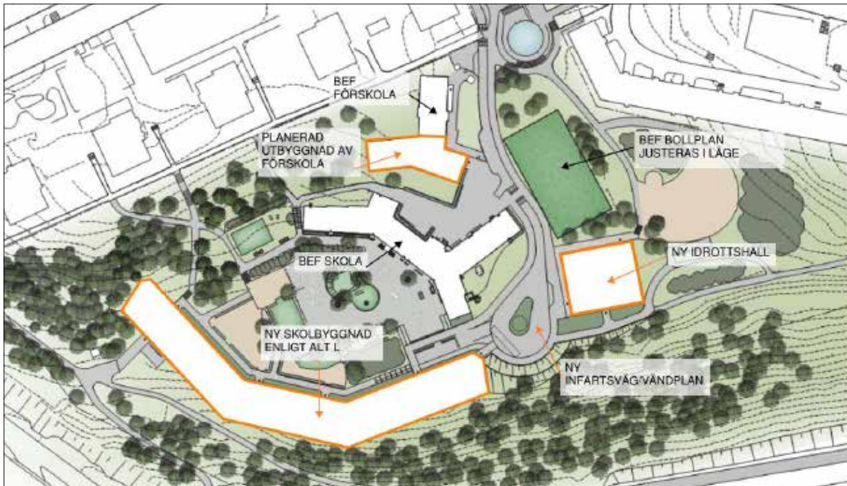
Alternativ L med tillbyggnadsalternativet för förskolan, SISAB 2020-01-13.