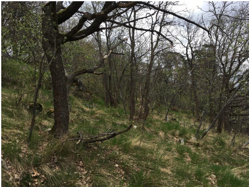
Figur 9. Objekt D utgörs av ekdominerad skog på sluttningen mellan Nybohovsskolan och Hägerstensvägen.

Motivering: Objektet bedöms ha visst biotopvärde i och med det varierade trädskiktet med ekdominans och förekomsten av värdeelement som hällar, blommande buskar och enstaka grova träd. Visst artvärde finns eftersom artrikedomen bland kärlväxter är högre än i det omgivande landskapet och eftersom en naturvårdsart påträffades.