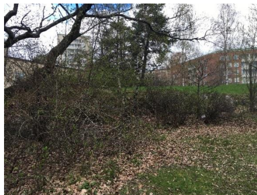
Figur 6. Naturvärdesobjekt A utgörs av en parkliknande miljö med varierad trädskikt.