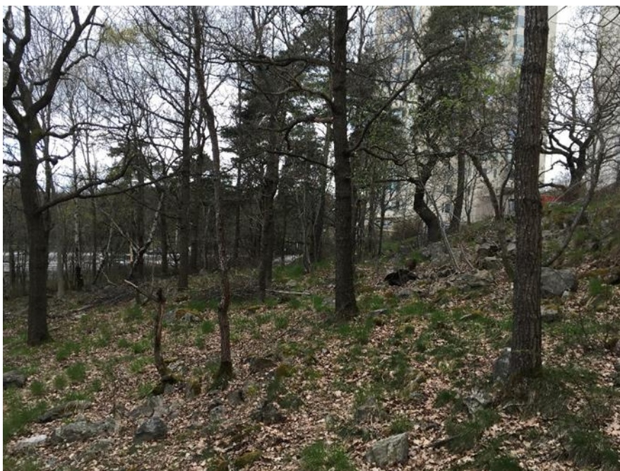
Figur 8. Gles ekdominerad skog i naturvärdesobjekt C.

Motivering: Objektet bedöms ha visst biotopvärde baserat på det varierade trädskiktet och förekomsten av värdeelement som block och enstaka grova ekar. Artvärdet är obetydligt.