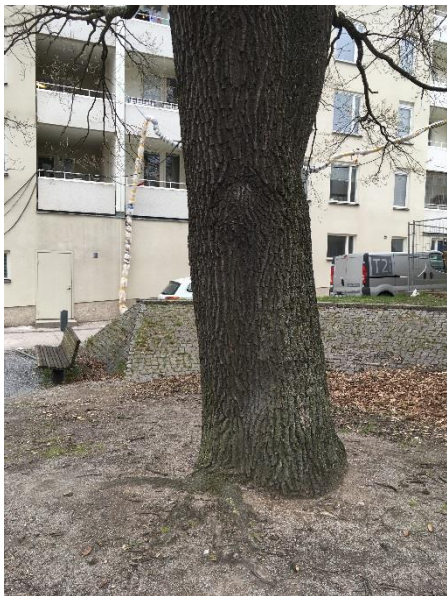
Figur 10. Naturvärdesobjekt E utgörs av en grov ek på Nybohovstorget.

Motivering: Den grova eken bedöms ha visst biotopvärde eftersom äldre och grova träd är ovanliga i inventeringsområdet. Artvärdet bedöms vara obetydligt.