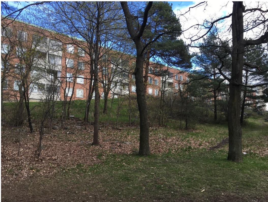
Figur 2 En stor del av inventeringsområdet utgörs av parkliknande skog som omger Nybohovsskolan. I norr angränsar inventeringsområdet mot bebyggelse.

inventeringsområdet. I anslutning till skolan finns även en förskola, en lekplats och två konstgräsplaner. Norra delen av inventeringsområdet utgörs av Nybohovstorget med planterade träd och en damm. Största delen av inventeringsområdet utgörs av parkliknande skogsmiljö som omger Nybohovsskolan (Figur 2). Ek, tall och björk är de dominerande trädslagen. Flera asfalterade gångvägar passerar genom skogsområdet. Eftersom skolområdet ligger på ett berg, ca 40 meter över havet, och marken sluttar ner mot väst och söder finns det stora höjdskillnader i inventeringsområdet.