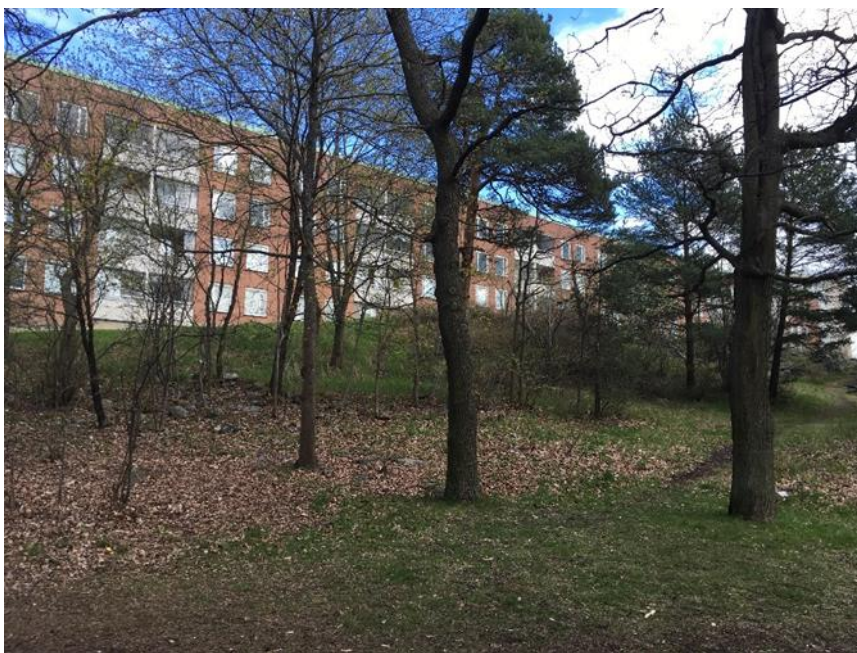
Figur 7. Objekt B utgörs av en halvöppen sluttning med lövträd.

Motivering: Objektet bedöms ha visst biotopvärde i och med det varierade trädskiktet och förekomsten av värdeelement som hållar, grenhögar, block och en grov ek. Visst artvärde finns eftersom artrikedomen bland kärlväxter är högre än i det omgivande landskapet och eftersom en naturvårdsart påträffades.