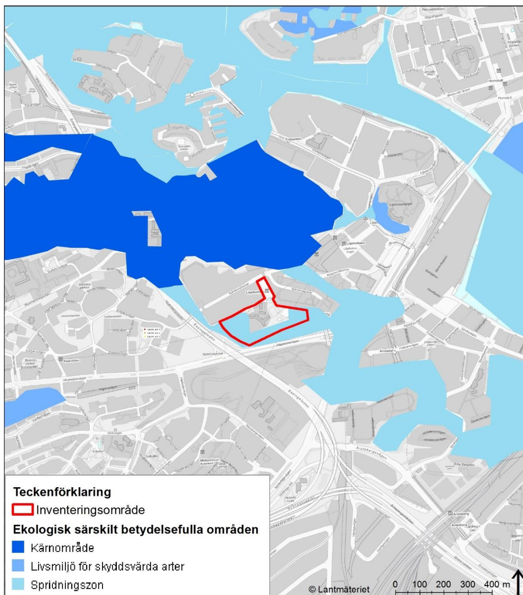
Figur 4. Inventeringsområdet ingår delvis i ett ekologiskt särskilt betydelsefullt område.

av en spridningskorridor som förbinder de värdefulla naturområdena Vinterviken och Årstaskogen. Spridningszonen är i dagsläget svag, bl.a. på grund av att Hägerstenvägen och Södertäljevägen utgör barriärer i spridningszonen.