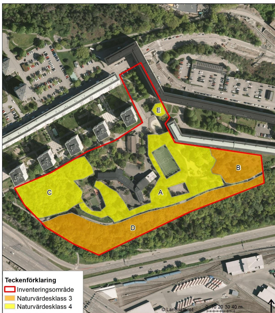
Figur 5 Naturvärdesobjekt i inventeringsområdet.

Av naturvårdsarter påträffades tjärblomster, som är en typisk art för hållmarkstorräng, på hållarna i naturvärdesobjekt B och C. Inga fynd av naturvårdsarter från inventeringsområdet finns inrapporterade i Artportalen.