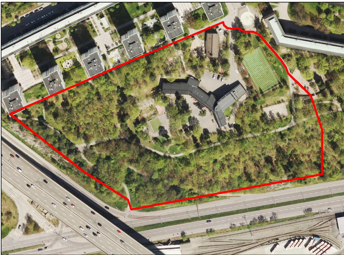
Figur 3 - Område som inkluderats i utvärdering.

Beräkningsresultat återges i bilaga 1 till denna utredning. I bullerkartan motsvarar gröna ytor en ekvivalent trafikbullernivå under 50 dBA ( L_{Aeq,24h} ) och dessa ytor ligger därmed inom Naturvårdsverkets riktvärde för lek, vila och pedagogisk verksamhet avseende ny skolgård.