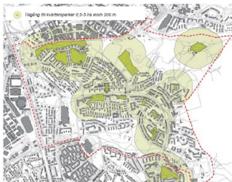
Tillgång till kvartersparker 0,5-5 ha inom 200 meter.