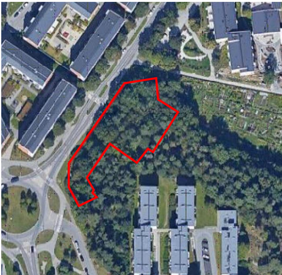
Figur 1. Översiktspild över planområdet. Undersökningsområde är markerat med rött. Kartunderlag: Google maps (2021).

Syftet med den miljötekniska undersökningen är att utreda om det förekommer föroreningar inom undersökningsområdet. Resultaten ska ligga till grund för rekommendationer kring hantering av eventuella överskottsmassor inom entreprenaden samt för eventuella vidare undersökningar eller åtgärder utifrån erhållna resultat.