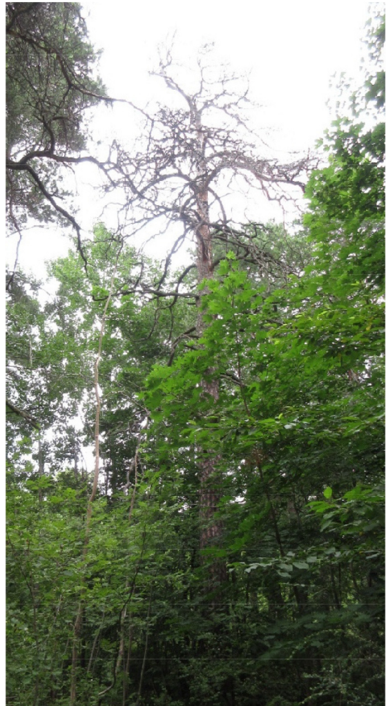
Den nydöda tallen, träd nr 2. Bör tas ned till högstubbe.