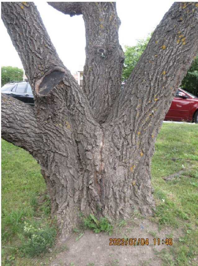
Träd nr 1 med instabil stamförgrening. Här finns det risk för stamklyvning.

Innan byggverksamheten påbörjas, bör ett fast staket sättas upp mot byggområdet som får stå kvar under hela byggtiden och som ska förhindra "intrång" av byggverksamheten till det skyddade området.