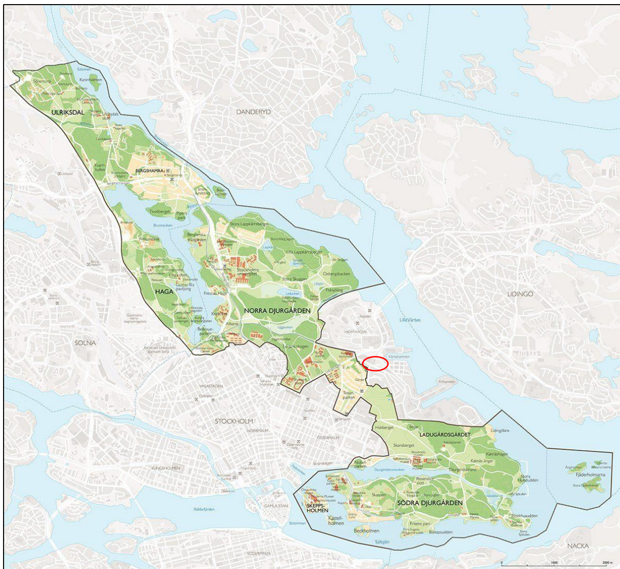
Karta 1. Nationalstadsparken. Inventeringsområdet är rödmarkerat och beläget utanför men alldeles intill nationalstadsparken.