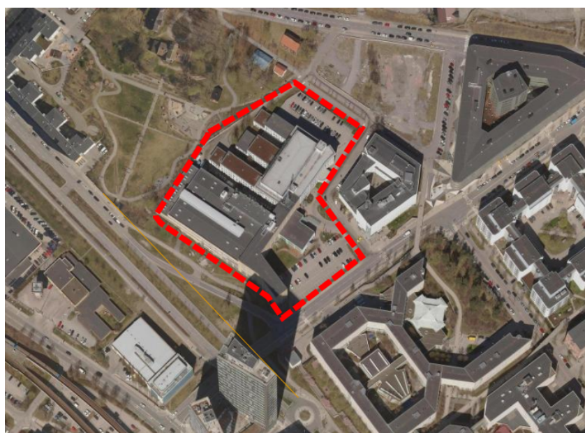
Ortofoto med fastigheten Reykjavik 1 markerad.