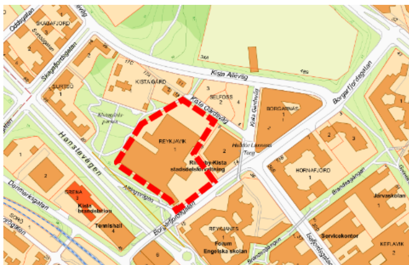
Karta med fastigheten Reykjavik 1 markerad.

Nordika III Fastigheter AB, nedan kallat Bolaget, är ägare till Kommanditbolaget Reykjavik 1 som innehar fastigheten Reykjavik 1 med tomträtt. Bolaget bedriver kontorsverksamhet i befintlig byggnad inom fastigheten. Bolaget har inkommit med en ansökan om markanvisning för ny bostadsbebyggelse om cirka 125 lägenheter på obebyggd del av fastigheten som nyttjas för parkering. Bolaget planerar vidare att del av fastigheten ska byggas om och användas som skola. Reykjavik 1 är belägen i Kista verksamhetsområde vid Hanstavägen i anslutning till Kista Gård samt nära det kommande utvecklingsområdet Kista Äng.