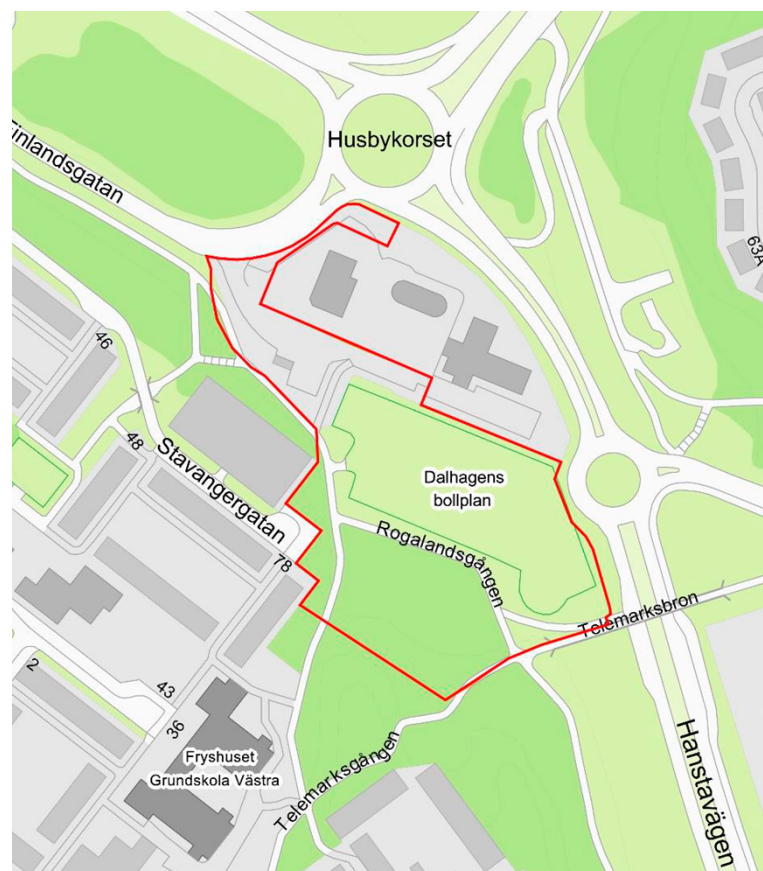
Planområdet markerat med röd linje (bild från planbeskrivningen)

Planområdet är beläget vid Dalhagens bollplan, mellan Hanstavägen och Finlandsgatan samt Telemarksgången och bostadskvarteren i Husby. Området omfattar del av fastigheten Akalla 4:1, Hamar 1 och s:4. Akalla 4:1 ägs av Stockholms stad och övriga fastigheter har privata fastighetsägare. Syftet med detaljplanen är att på platsen för Dalhagens bollplan möjliggöra att uppföra en skola med kapacitet för cirka 900 elever, från förskoleklass till årskurs nio, samt en fullstor idrottshall. Detaljplanen syftar även till att möjliggöra en ny lokalgata mellan Hanstavägen och Finlandsgatan, med avsikt att integrera Kista, Husby och Akalla. I detaljplanen ingår även att säkerställa angöring och pågående markanvändning, drivmedelsförsäljning och detaljhandel, på intilliggande fastigheter.