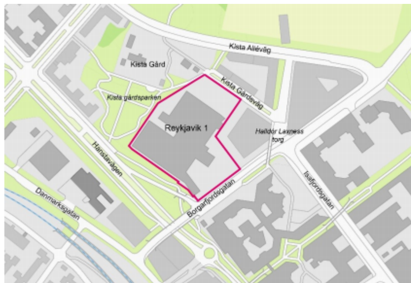
Planområdet markerad med röd linje (från planbeskrivningen)

Detaljplanen syftar även till att bidra till att skapa ett levande gaturum utmed Borgarfjordsgatan varför bottenvåningarna på den nya byggnaden regleras för att rymma lokaler för centrumändamål.