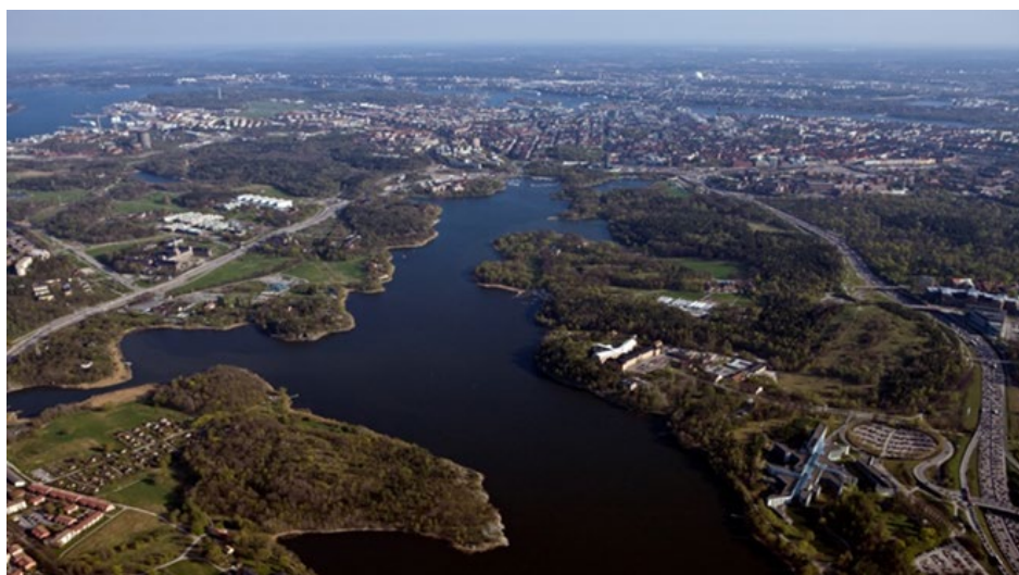
Brunnsviken sett från norr.

Avrinningsområdet för Brunnsviken delas av tre kommuner. Den största delen, nästan 60 %, ligger i Solna, medan drygt 25 % respektive 15 % är fördelat över Sundbyberg och Stockholm. Åtgärdsprogrammet har tagits fram i samarbete mellan de tre kommunerna. Programmet består av två delar; denna del med fakta och åtgärdsbehov, dels separata genomförandeplaner för respektive kommun. I den senare presenteras mer konkreta åtgärder, bland annat geografiskt utplacerade åtgärder. Denna faktadel har tagits fram gemensamt av Stockholms stad, Solna stad och Sundbybergs stad tillsammans med Stockholm Vatten och Avfall, Solna Vatten och Sundbyberg Vatten och Avfall.