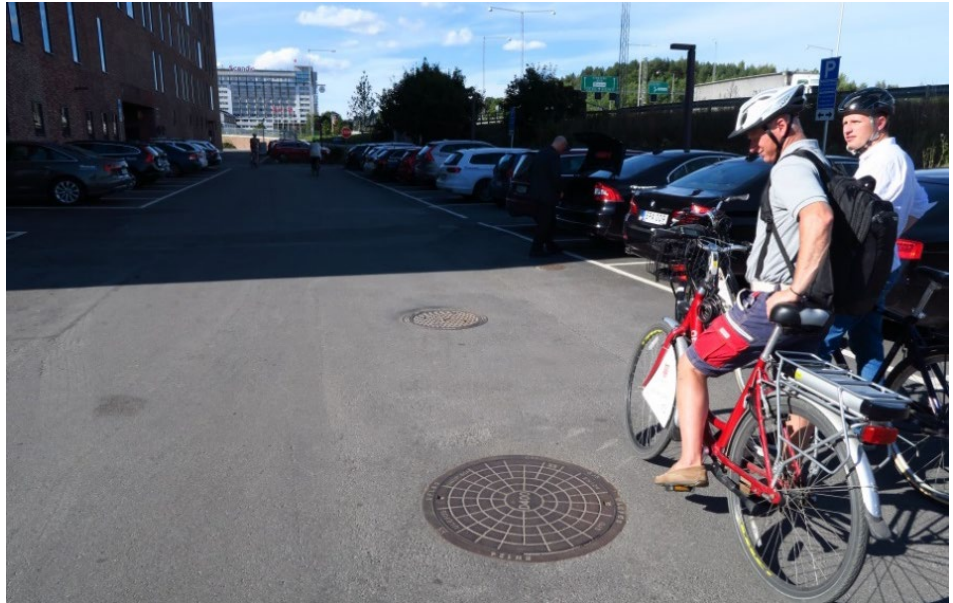
Råstaån går i kulvert under The Winery Hotel och Uppsalavägen. På hotellets parkering finns möjlighet till etableringsplats för flödesproportionell provtagning i ån.