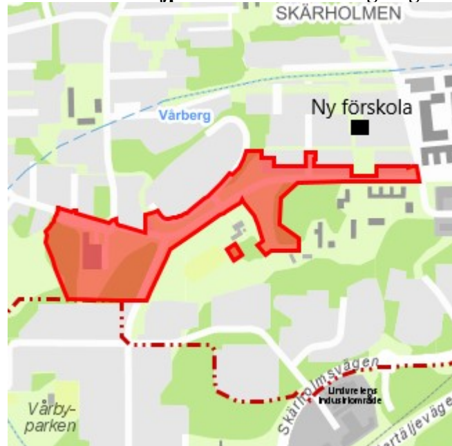
Karta 1: Detaljplaneområde Vårbergsvägen

Mot bakgrund av nybyggnationen och befolkningsökningen bedömer förvaltningen att en ny förskola bör byggas.