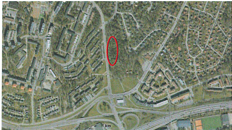
Bild 2. Med rött markerat markanvisningsområde

Förslaget innehåller nybyggnation av ca 80 lägenheter i flerbostadshus. Bolaget föreslår att lägenheterna ska upplåtas med bostadsrätt eller äganderätt.