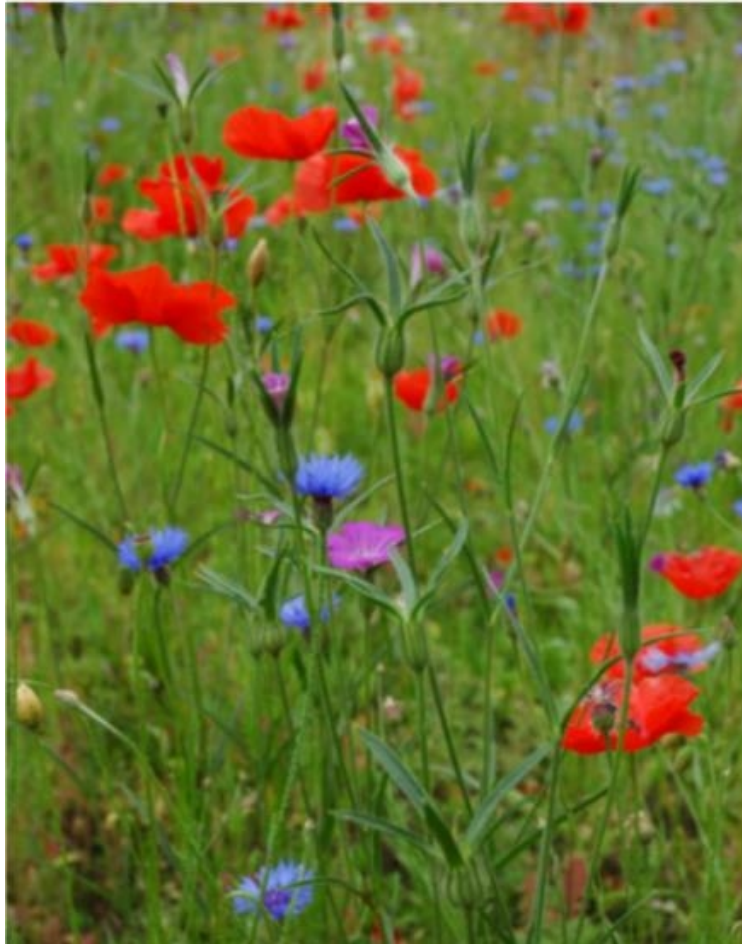
Bild 2. Målbild ängs typ som ansökan avser.