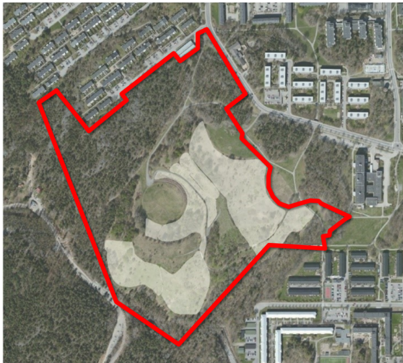
Bild 3. Föreslagen yta för utökad slåtter.