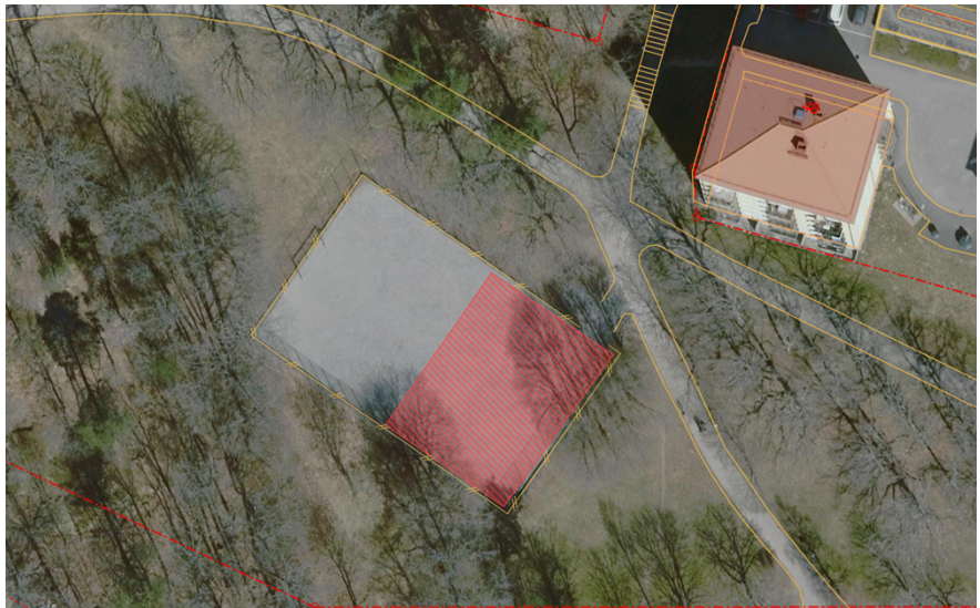
Bild 2. Utsnitt placering utegym på grusplan.