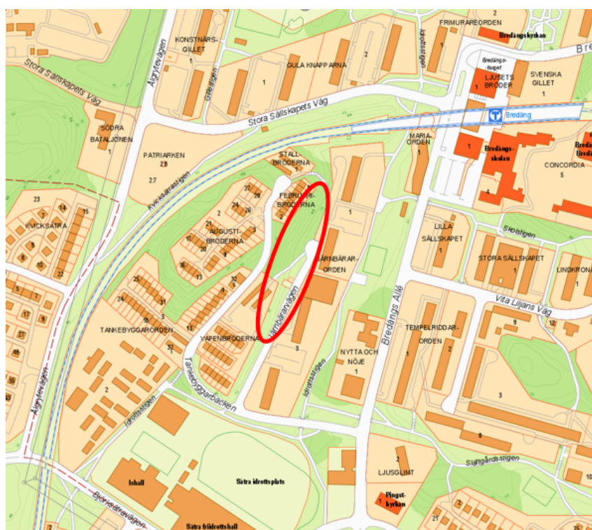
Bild 1. Det aktuella markanvisningsområdet markerat i rött

Storstaden har under de senaste fyra åren fått två markanvisningar om totalt 140 lägenheter.